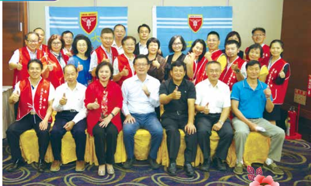
■為能成功承辦校友總會會員代表大會，辛苦的籌備會幹部們

中華民國淡江大學校友總會第11屆第1次會員代表大會於台南舉行，計有380多名代表及眷屬參加，是歷年來最多的一次。為了迎接來自各縣市校友，台南市校友會舉辦10餘次幹部會議，希望校友們感受台南的熱情，賓至如歸。