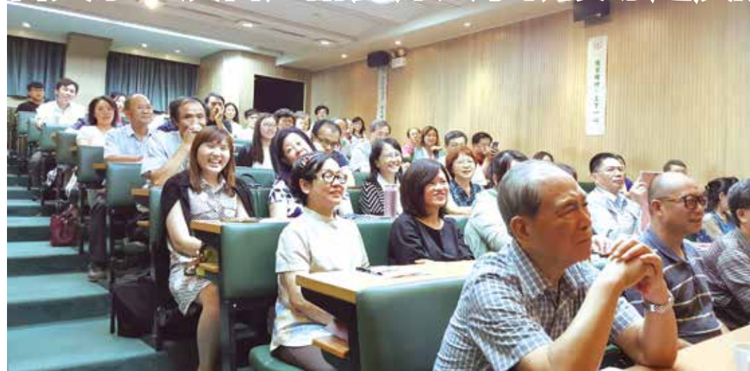
■日文系系友會舉辦演講將會場擠得座無虛席