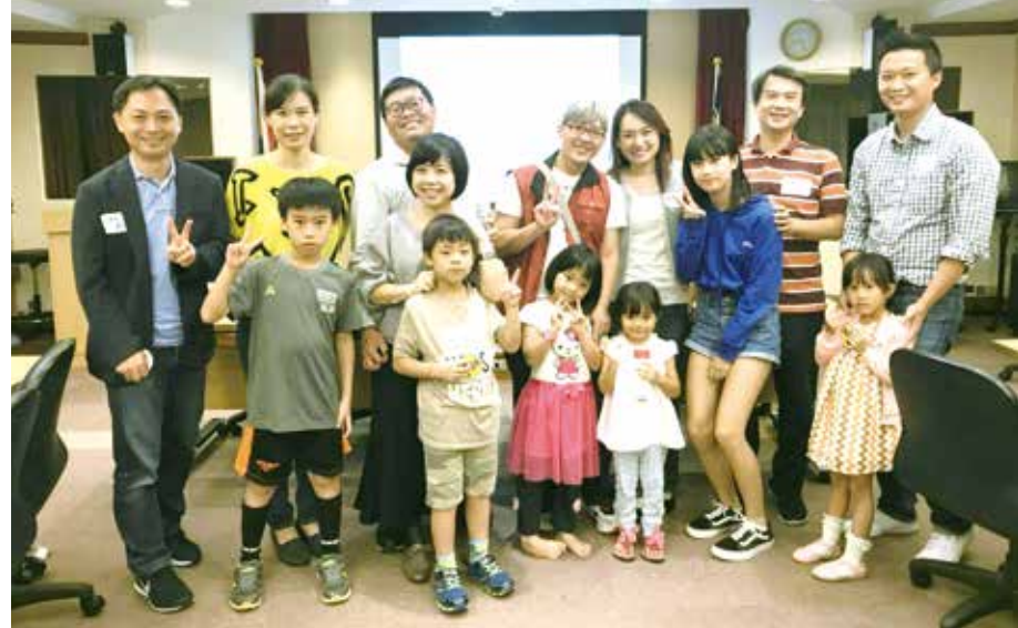
■跨越廿多年的康輔人攜家帶眷首度返校聯誼

鼎盛，要參加康輔，必須經歷數百人的海選且通過重重關卡，入選康輔的都是精英。剛畢業的學弟妹們則談到現在經營社團的辛苦之處，也分享參加康輔所學習的服務精神與從中培養到的軟實力。