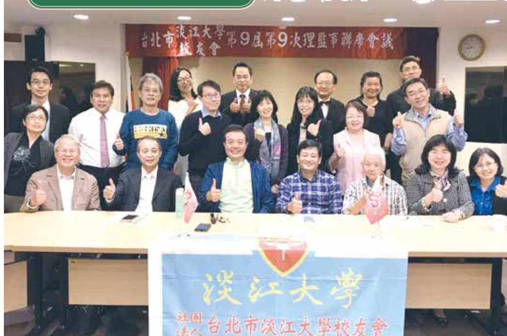
■台北市校友會第9屆第9次理監事聯席會後合影