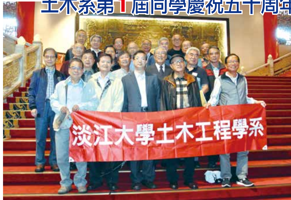
■土木系第一屆同學結緣50年紀念

土木系創立於1967年，首任系主任是曾擔任台灣省建設廳水利局局長的章錫綬先生。第1屆土木系畢業的同學們，相約10月28日(六)中午在台北圓山飯店歡聚，慶祝結緣成為同學50周年，並邀請到當年授課的漫義弘與郭瑞芳教授，以及現任主任洪勇善參加。