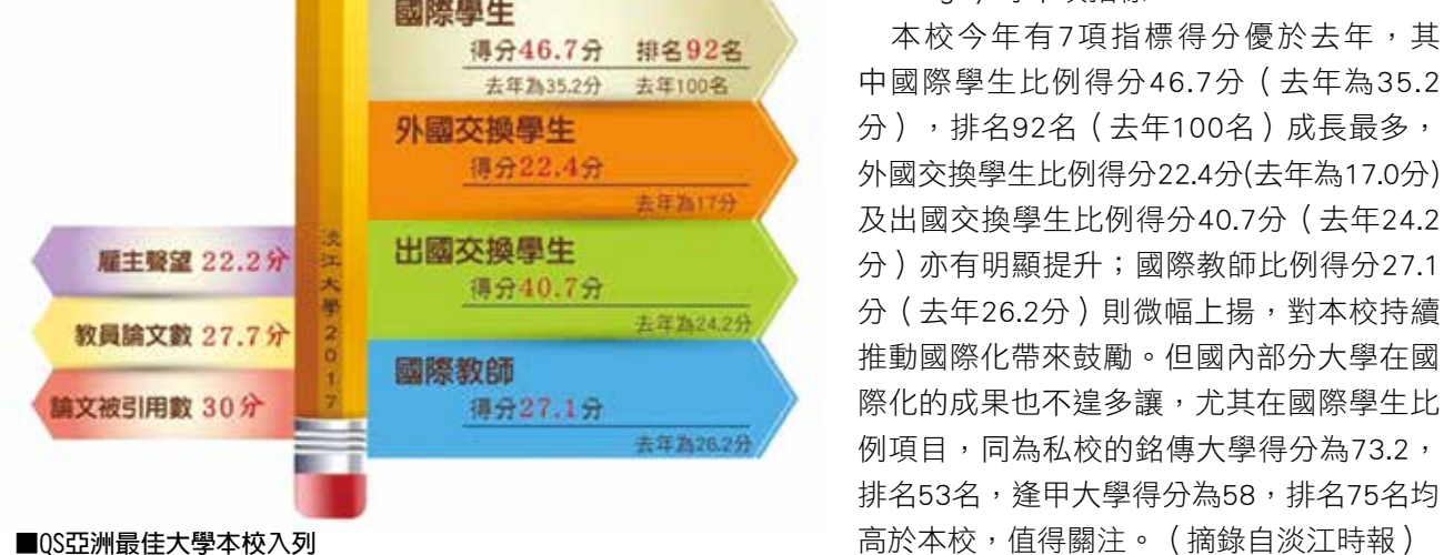
■QS亞洲最佳大學本校列入

QS自2009年起進行亞洲大學排名調查，部分準則與主要的世界大學排名相同，不過應用較適合獨特區域性大學的方法論，及包括學術聲望(Academic Reputation)、雇主聲望(Employer Reputation)、生師比(Faculty Student)、國際教員比例(International Faculty)、博士教員比例(Faculty Staff with PhD)、教員論文數(Papers per Faculty)、論文被引用數(Citations per Paper)、國際學生比例(International Students)、出國交換學生比例(Outbound Exchange)、外國交換學生比例(Inbound Exchange)等十項指標。