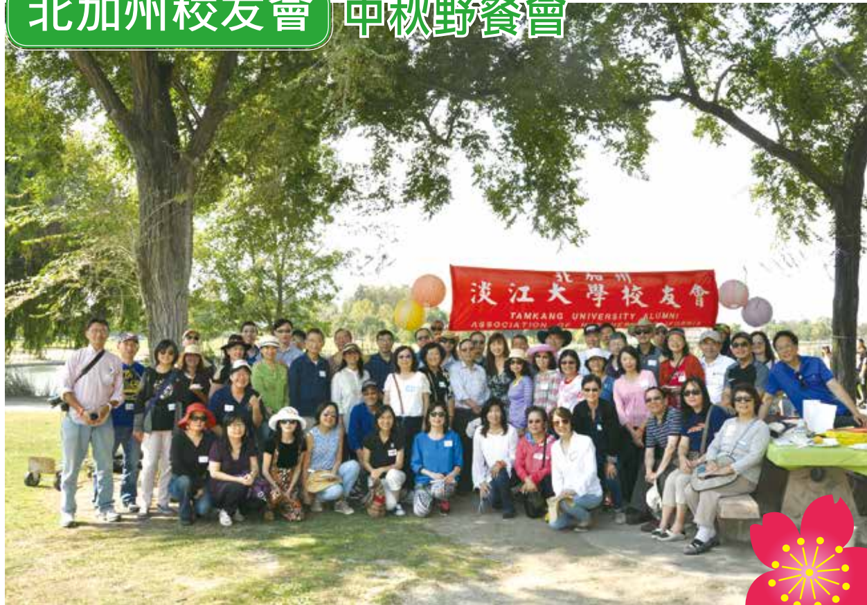
■北加州校友會溫馨慶中秋

北加州校友會於9月16日(六)上午11時在Fremont市Lake Elizabeth舉辦中秋野餐會。駐舊金山辦事處處長馬鍾麟、Fremont市長高敘加、金山灣區僑教中心主任吳郁華、會長許明玉、僑務委員陳松、林身影、北加州大專校聯會會長宋貞、歷任會長及僑團代表等逾百人出席。