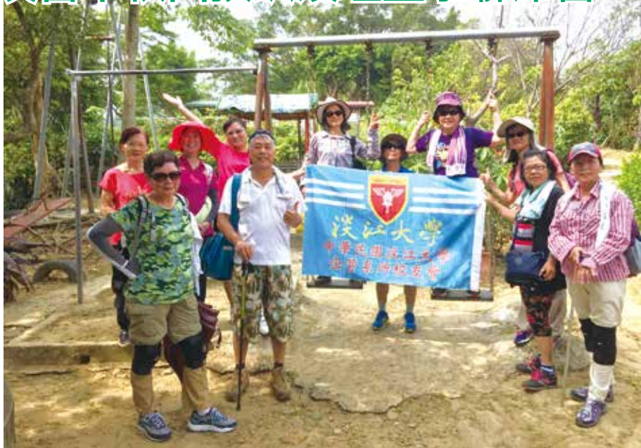
■童心未泯的企管系友歡樂合影

10月19日(四)下午6時30分在校友聯誼會館，召開本屆第8次理監事聯席會。會中決議下屆理事及理監事等推薦名單，並通過部分章程修訂提案。同日下午8時舉辦專題講座，特別邀請企管系主任暨所長楊立人博士前來主講「如何建立個人品牌」。母校各系所校友學長們參與非常踴躍，校友會館座無虛席，本次理監事聯席會及專題講座順利圓滿。