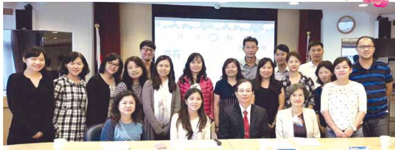
■前教育部長吳清基(前排坐者右2)等位師長們歡迎所友回娘家

教政所所友會於10月29日(日)在校友聯誼會館舉辦所友回娘家活動。當日也舉辦第3屆所友會理監事改選。由於教政所所友大多服務於教育機關或各級學校，當日各屆所友齊聚，也互相分享在校所學與職涯聯結的收穫與心得，活動氣氛熱絡。本次活動也讓本所與所友的連結更加緊密，並加深所友的認同感與向心力。