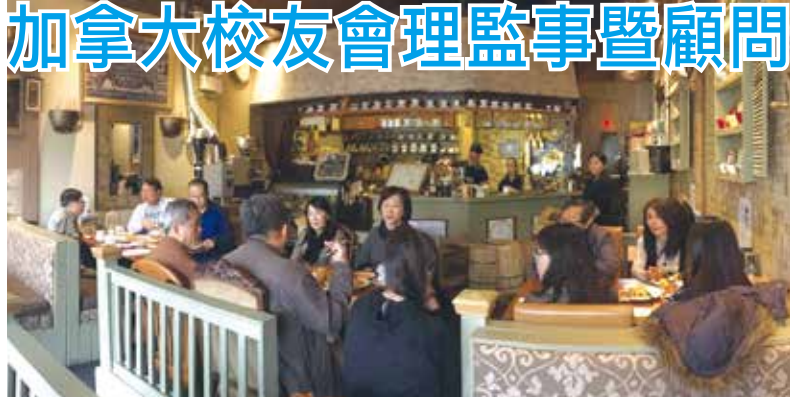
■加拿大校友會召開理監事暨顧問會議

動，理監事們除了安排返台參加之外也將積極推動校友們共襄盛舉，會議圓滿成功，下次會議訂於2018年1月21日舉行。