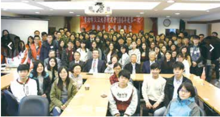
■台北市校友會獎助學金頒獎典禮，捐款學長姐與受獎學弟妹們歡樂合影

午由 33名愛膳餐券贊助者與受贈同學見面，分享捐贈學長姐社會及人生經驗，不時傳來歡笑聲，除拉近彼此的距離，更讓人覺得善種子正在發芽。