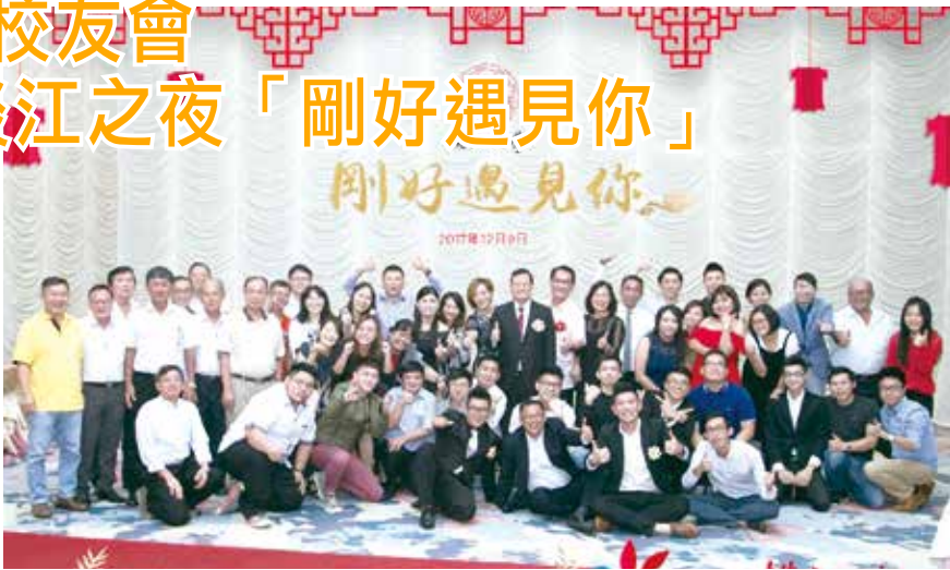
■淡江校友與章計平大使(後排中立者)合照

馬來西亞留台校友會於106年12月9日(六)於八打靈再也富豪海鮮酒家，舉辦21週年淡江之夜「剛好遇見你」。淡江之夜為該會每兩年一次的活動，配合2018年世界校友會雙年會的召開，特別藉此宣傳雙年會活動，並讓台灣辦事處與馬來西亞校友們齊聚一堂，交流情誼、暢談未來，再續台灣情誼。本次活動出席有中