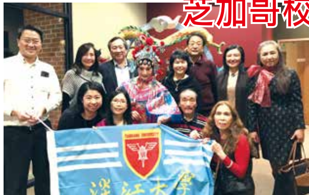
■芝加哥校友會校友們於歲末晚會中展演才藝

用母校校園，讓與會者對淡江大學校園有所認識。精彩內容已放到youtube，歡迎觀賞。 https://www.youtube.com/watch?v=eTe8caZyYrg&feature=youtu.be (2017美中芝加哥淡江大學校友會演出-台灣文化組曲)