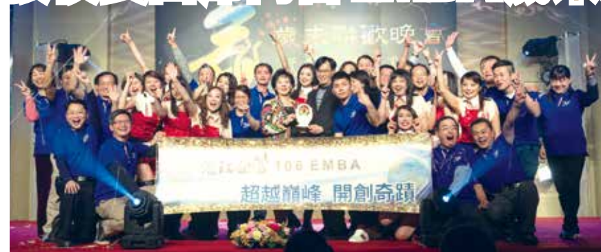
■企管所勇奪EMBA年度歲末聯歡才藝冠軍，開心與校長(前排中)合影