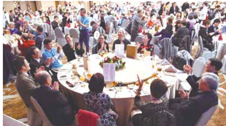
■2017年系所友會聯合總會歲末聯歡晚會盛況