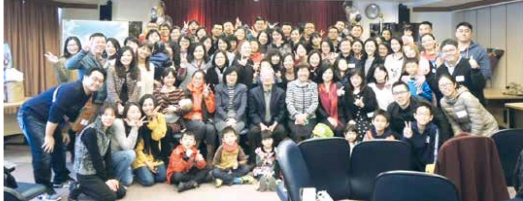
■應用日語系九屆的系友歡聚感恩恩

淡江大學應用日語系在結束招生後，共計九屆的系友們，以「不散場的青春，我們老地方見」為主題，於1月13日(六)上午11時，在台北校園校友聯誼會館舉辦了第一次應用日語系系友會暨感恩會。