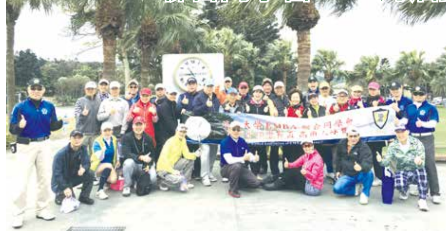
■EMBA聯合同學會於理事長暨隊長孟高爾夫球賽後開心合影

EMBA聯合同學會新年度活動，首先於1月5日(五)籃球社的尾牙聚餐展開序幕，校友們將台北田園海鮮餐廳塞得水洩不通！由於去年EMBA全國賽中得到全國145間大專院校的第五名，是歷年來最好佳績；今年全國籃球賽又將由淡江大學舉辦，故此次尾牙除了慶功，也期望在加入卓越新血後，今年能夠再創佳績！