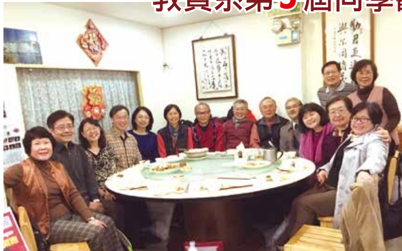
■教資系同學自各地返校相見歡聚

教資系第5屆(68級畢業)系友於2月11日(日)上午11時30分，在六品餐廳舉行餐敘，飯後還回到台北校園校友聯誼會館閒話家常。