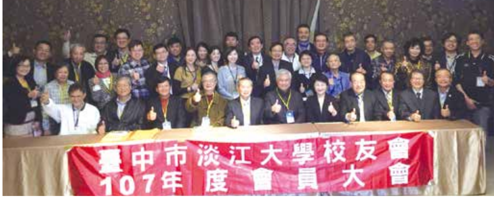
■台中市校友會第3屆第1次會員大會合影