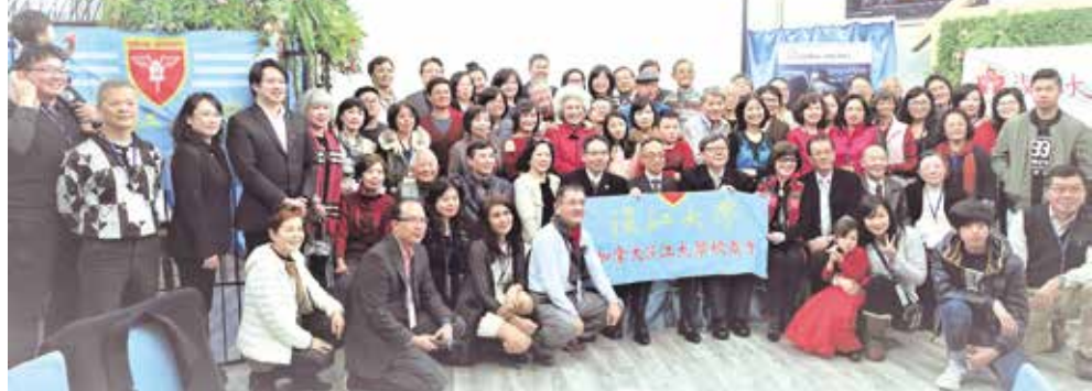
■加拿大校友會2018新春聯誼會合影

加拿大校友會於2月4日(日)，在Richmond的華府中菜餐廳舉行新春聯歡會。當日活動，與會出席之貴賓、校友及眷屬，正好百位，非常熱鬧。