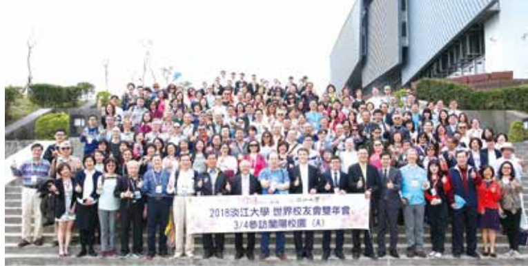
■世界校友兵分二路實地參訪蘭陽校園