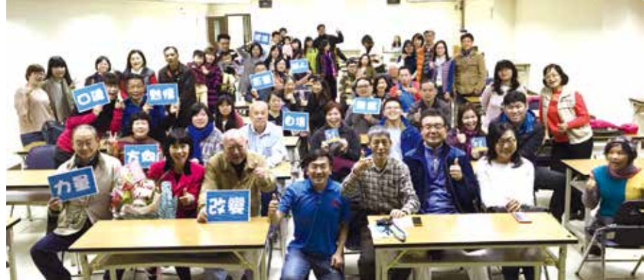
■基隆市校友會迎新送舊、新書發表

場的重要關鍵，包括「方向」、「自信」、「口碑」、「熱情」、「專業」、「價值」、「力量」、「助人」、「改變」、「影響」。由於長年在家庭中心演講，所以她個人與一些協會共同捐出上百本有聲書給家扶中心，希望對學生和正在職場奮鬥的上班族能有激勵的能量。藍學姐台風穩健大方，全場是妙語如珠，笑聲不斷。