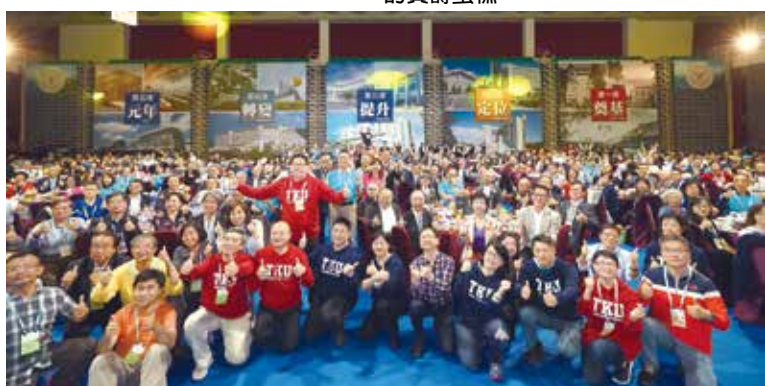
■2018世界校友雙年會晚宴合影