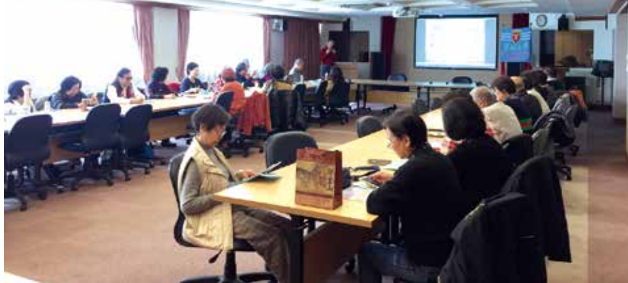
■電腦聯誼會講座活動一景

講座進行方式，首先請來賓提出相關問題，彙整後，透過討論並解釋，解釋原因、處理原則及檢測步驟，再由影片資料瞭解解決問題的方法，讓與會來賓收穫滿滿，還想再邀請新朋友一起加入聯誼會活動！