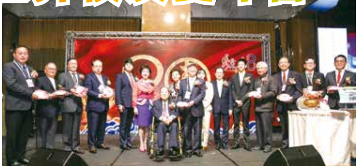
■世界校友與創辦人歡慶90大壽

3月3日(六)配合每年一次的春之饗宴活動，上午9時於淡水校園同舟廣場舉辦趣味活動，10時舉辦嘉年華會活動，11時舉辦春之饗宴。接著在守謙國際會議中心有蓮廳舉辦世界校友雙年會及淡江論壇，晚宴則