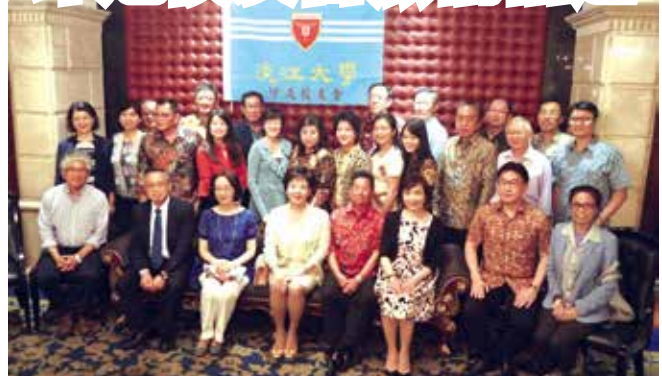
■校長(前排中)率團赴印尼訪問，與印尼校友會校友們歡聚合影

此行係張校長首次率團赴印尼訪問印尼校友會，受到校友們熱情與親切的款待。印尼校友會表示未來會更加努力，且有意願將主辦世界校友雙年會。(本文摘自淡江時報，圖由國際處提供)