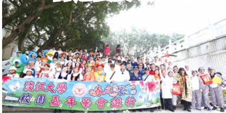
■2018春之饗宴-嘉年華會