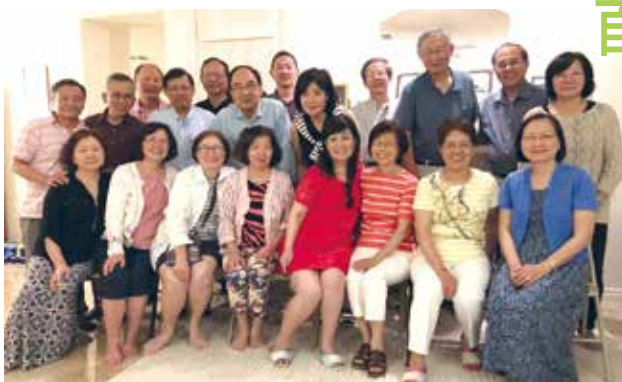
■首屆化學系美加系友溫馨相聚合影

化學系美加系友於4月24~26日(二~四)，在美國內華達州和猶他州舉行第一屆系友聚會。經過半年以上的籌備與系友們的積極參與，前來參與的系友及家屬們共計26位，活動圓滿成功，留下難忘的回憶。