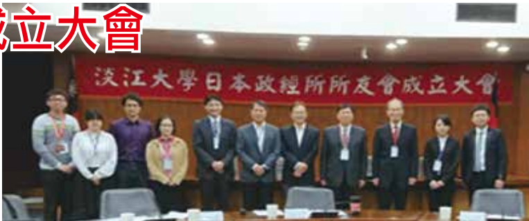
■日本政經所所友會成立大會

會後將提交會議紀錄至內政部，正式成立日本政經所所友會。未來預計於6月份召開理監事會議，並與母校日本政經所合作，共同舉辦國際研討會及活動，期能集合所友及所上資源，共同推動會務及所務，形成雙贏局面。