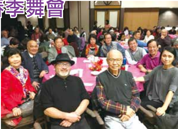
■逾200位嘉賓參加2018南加州校友會主辦之春季舞會

校友會首次舉行情人節舞會是在1996年，至今已逾廿年。當晚雖然音響出了點小差錯，好在淡江人臨機應變和通力合作的能力，最後有驚無險，節目順利進行，活動圓滿完成。大家對當晚的歌曲演唱，舞曲安排和食物都讚不絕口。卡拉ok 演唱中穿插著精彩排舞、土風舞和宮廷舞蹈表演；宵夜則提供豆花與蛋糕，更是勾起了大家對台灣的回憶而大受歡迎。這次舞會的難忘經驗，將會分享傳承讓南加州校友會的舞會能繼續每年熱鬧地舉辦，持續讓校友和社區朋友們連絡感情，共渡愉快的夜晚！