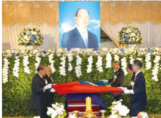
■創辦人告別式備極哀榮

本校創辦人張建邦博士於5月26日(六)上午在臺大醫院辭世，享壽90歲，業於6月21日(四)下午舉辦告別式。為表彰創辦人對國家社會之貢獻，特別進行覆蓋國旗儀式，象徵最高榮譽，前總統馬英九、前副總統呂秀蓮、蕭萬長、吳敦義與各界人士逾800人出席悼念張建邦先生。