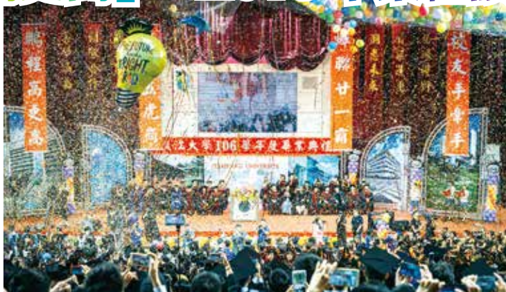
■淡水校園2018畢業典禮(圖/陳志均提供)

上大步向前，對你而言是個重要的課題。淡江的好山好水能讓你身心放鬆，淡江的多元課程及豐富資源能讓你自在學習，淡江的「三環五育」可以鍛鍊你卓越的心靈，淡江的學長姐則是你未來的最大的支援！歡迎選擇淡江，我們期待與你一起創造未來的「淡江榮耀」！(文/圖摘自淡江時報)