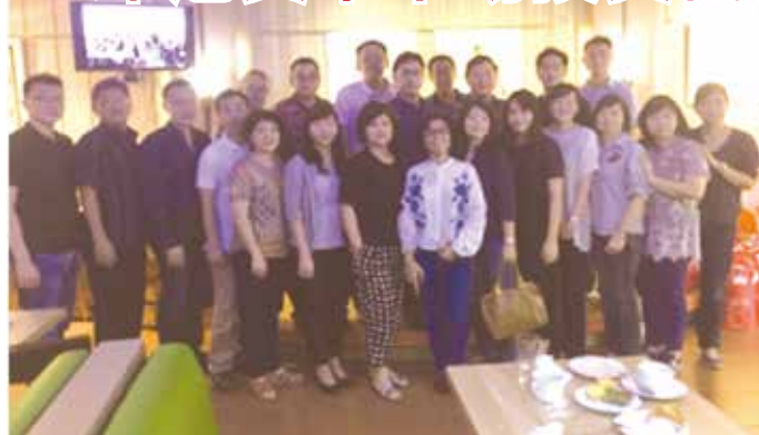
■印尼資本市場機會和挑戰座談會合影

印尼校友會於5月19日(六)在雅加達DLIGHT餐廳，舉辦印尼資本市場投資機會和挑戰座談會。