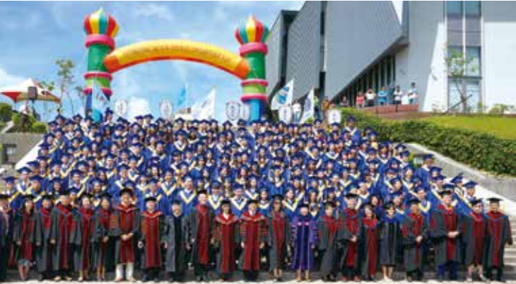
■蘭陽校園2018畢業典禮