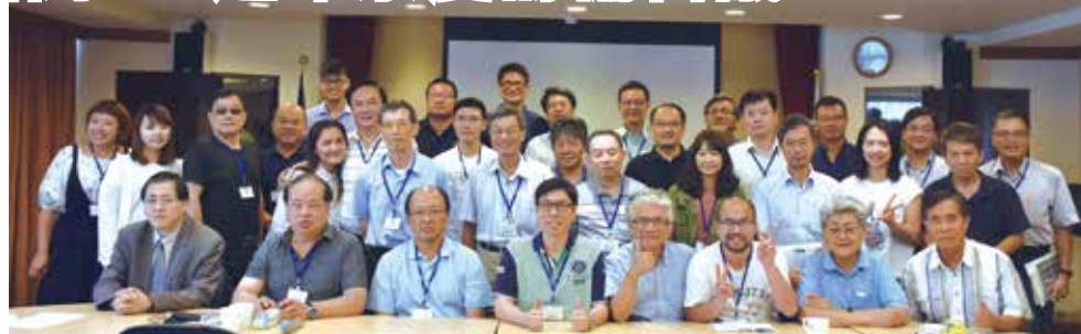
■化學系邀請各屆系友代表共商慶祝60週年系慶大計

建議：60週年慶前可先以球隊比賽方式經營系友團隊的感情，活動內容策畫可提供活潑小遊戲以及展現化學系特色之活動以吸引系友參與。並加強關懷系友以建立良好的互動關係，並藉由與系友間的合作交流，讓系友們感動一同回到母系共襄盛舉。