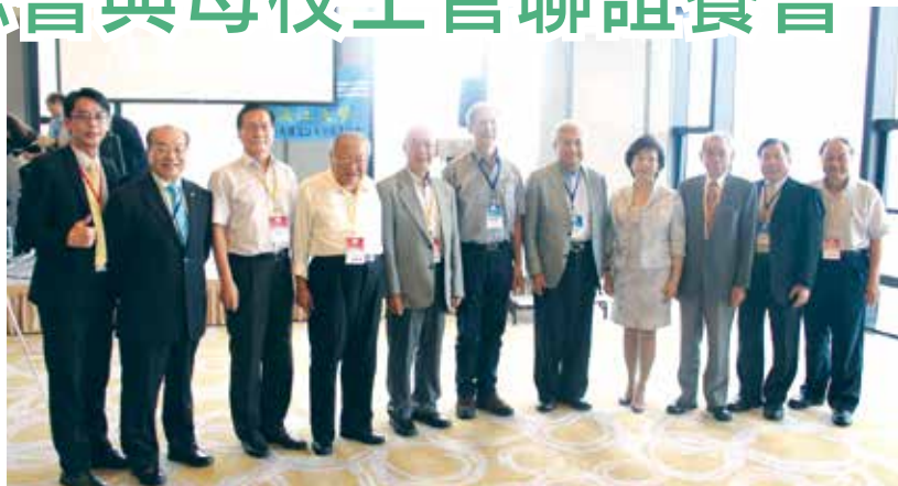
■校友總會與母校主管聯誼餐會

中華民國校友總會於9月15日(六)，在臺北萬豪酒店寰宇廳舉辦「總會與母校主管送舊迎新聯誼餐會」，除了感謝卸任主管任內付出、祝賀新任主管就任，也促進母校各單位與校友會的互動。