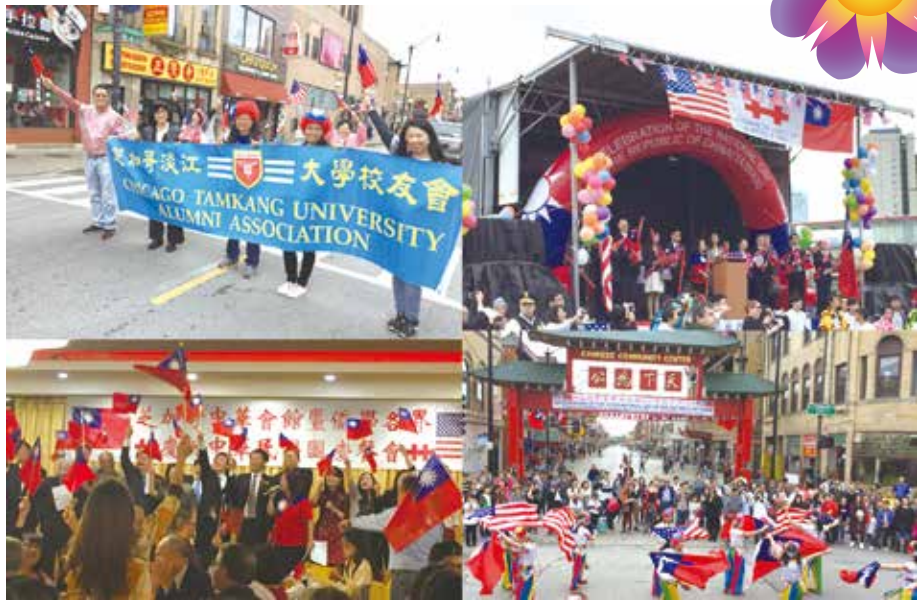
■芝加哥校友會歡慶雙十國慶遊行

參加遊行的貴賓包括芝加哥辦事處處長、副處長及各組長、僑教中心主任、副主任、中華會館眾主席、維斯蒙市長及美國政要名士。當天的國慶晚宴亦是熱鬧歡騰，淡江校友會出席一桌，共同歡度雙十國慶。