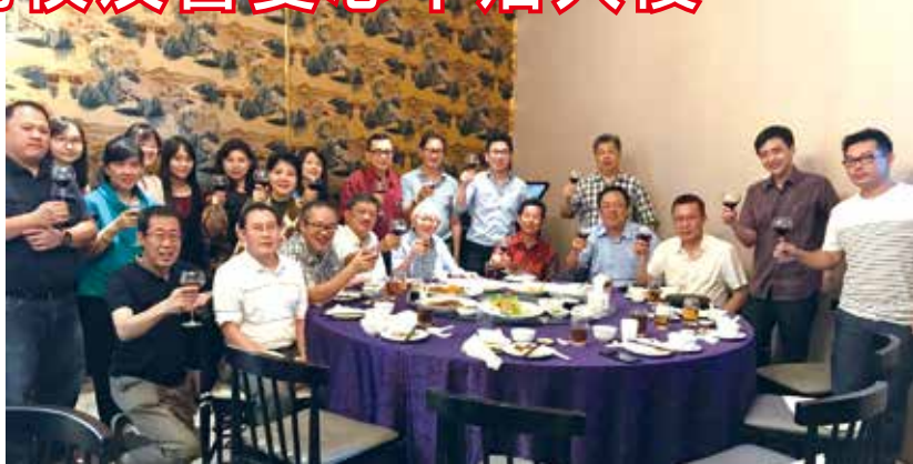
■印尼校友會舉辦中秋團圓

今年9月印尼龍目島及中蘇拉威西接連發生強烈地震，響應僑界及臺商兩度發起募捐活動，印尼校友會亦參與捐贈愛心善款予中蘇災民，努力具體展現了愛心不落人後，以及悲天憫人的人道精神。