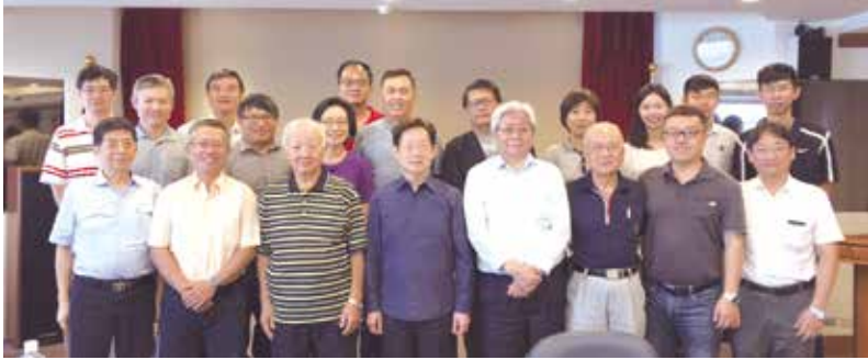
■水環系系友會第3屆第3次理監事聯席會議合影