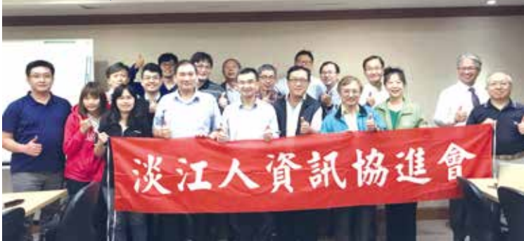
■淡江人資訊協進會講座合影

時間，會員也十分踴躍提問與交流。在未來，淡江人資訊協進會將會繼續舉辦多場演講，期待大家一同共襄盛舉！