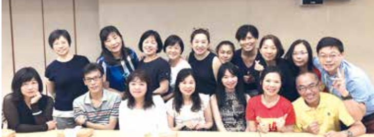
■西語系同學會講座活動合影

言談輕鬆幽默，分別從攝影概論、攝影技巧、自拍攻略等各點切入，解說拍出美照的秘訣，並在在座者分享其二十餘年的採訪攝影經驗。現場笑聲不斷，互動熱烈。