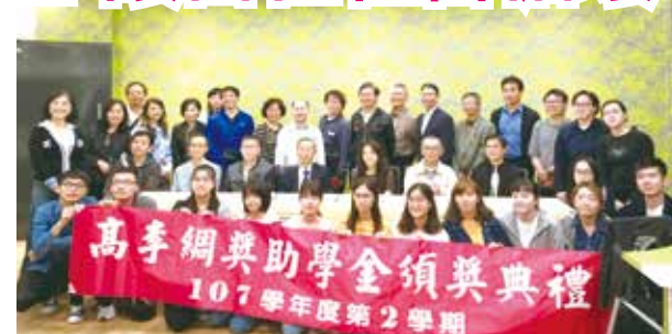
■「高李綱獎助學金」及「三德獎助學金」頒獎典禮