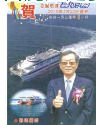
■賀百麗航運雲豹輪首航