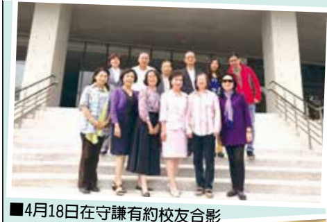
■4月18日在守謙有約校友合影