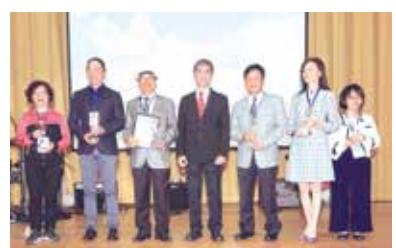
■傑出系友頒獎-外語學院