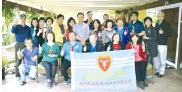
■3月23日乒乓球聯誼賽/校友會