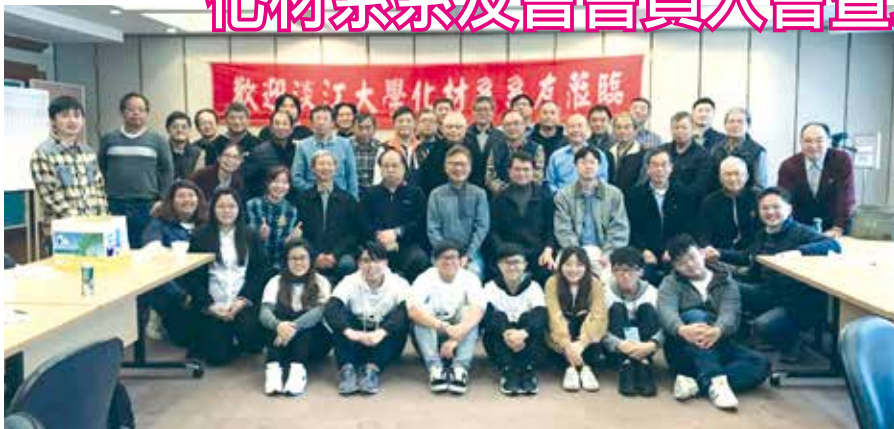
■化材系系友會第7屆第1次會員大會合影