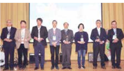
■傑出系友頒獎-商管學院I