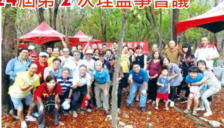
■高雄市校友會澄清湖烤肉同歡

另於4月21日(日)於澄清湖舉辦「澄清湖烤肉一日遊」活動，約70人參加。當日上午綿綿細雨，為避免大家淋雨又能烤的盡興，會務團隊還一大早就烤肉區辛勞搭棚，高理事長特別感謝會務團隊辛勞的付出，並謝謝大家的參與。大家在熱鬧的活動中共渡美好假日。