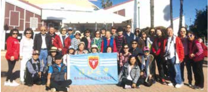
■3月16日南加州校友會春季旅遊大合影