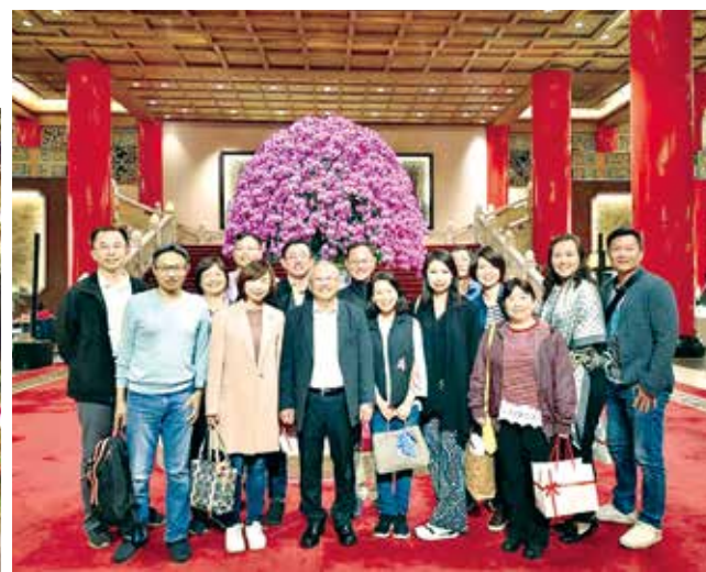
■國貿系校友與導師-林志鴻副校長(前排左3)

30年的友誼。30年過去，同學們各奔東西，多位同學在大陸工作，平時藉由通訊軟體維繫情感，此次百忙之中抽空相聚。遊畢校園，當晚設宴於圓山大飯店，林副校長應邀一同歡聚。宴席終了，老師與同學們互道珍重，並相約再聚。