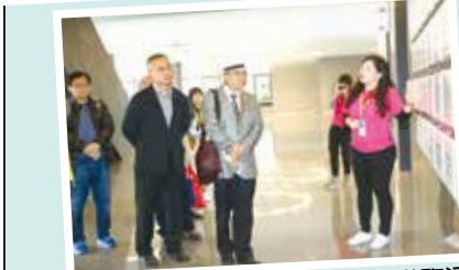
■3月23日守謙導覽活動