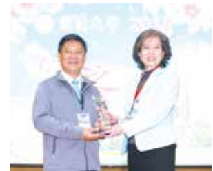
■傑出系友頒獎-教育學院