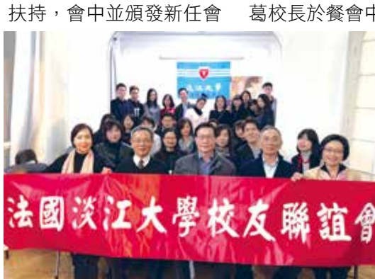
■法國校友會核心團隊