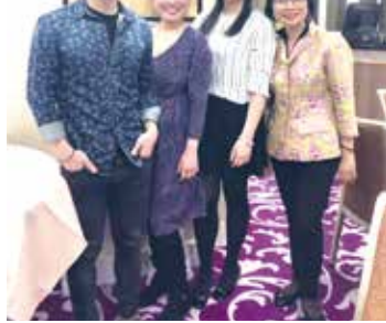
■英國校友會核心團隊