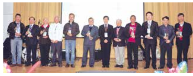
■傑出系友頒獎-工學院