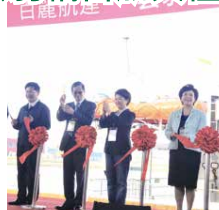
■雲豹輪首航典禮，右起：淡江大學董事長張家宜、台中市長盧秀燕、澎湖校友會理事長藍俊昇、交通部長林佳龍