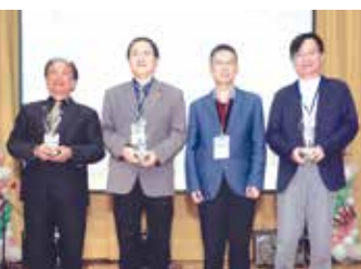
■傑出系友頒獎-理學院