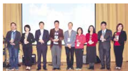
■傑出系友頒獎-商管學院II