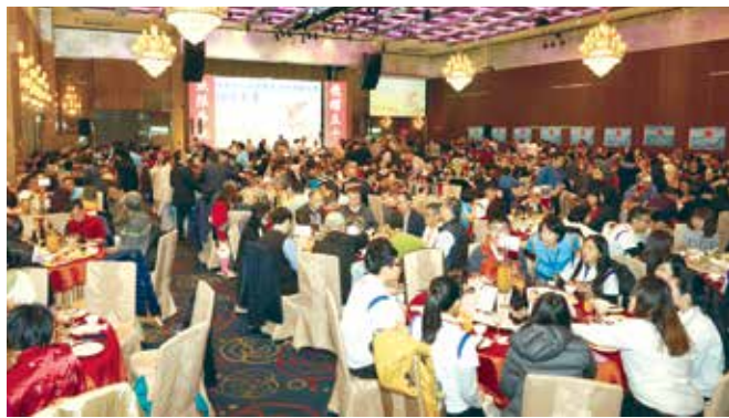
■台北市校友會50週年感恩餐會