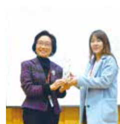
■傑出系友頒獎-全球發展學院