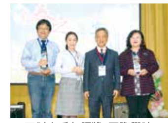
■傑出系友頒獎-國際學院