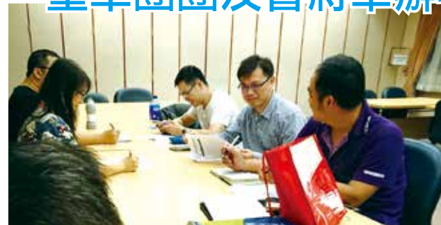
■童軍皂飛車競賽籌備會議