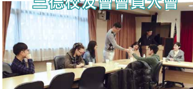
■三德校友會會員大會

會議、討論下半年聯誼活動，以連繫校友之間的情感，並發揮三德會「三德—忠孝、仁義、勤儉」的精神，期許將來能夠貢獻社會。