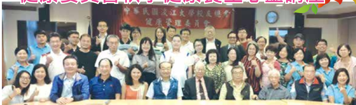
■健康委員會秋季健康養生心靈講座合影