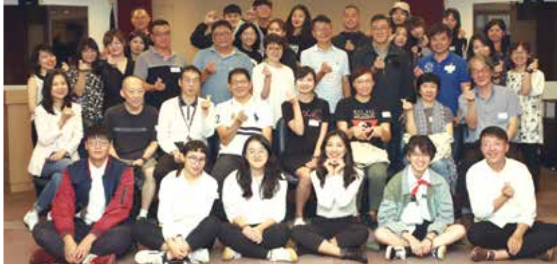
■大傳系友回娘家活動合影

會務報告後進行分組活動，讓跨屆系友與在校生們交流分享校園和職涯生活，在校生們獲益良多。同時藉由此大機會廣為宣傳明年5月的畢業成果展《噪物者》，期待系友們多多支持。本次系友大會於下午5時許圓滿落幕，相約明年再聚。