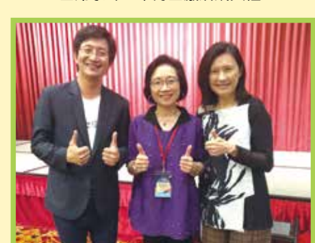
■10.20出席卓越校友會迎新聯誼活動與立法委員蔡適應校友(左1)合影