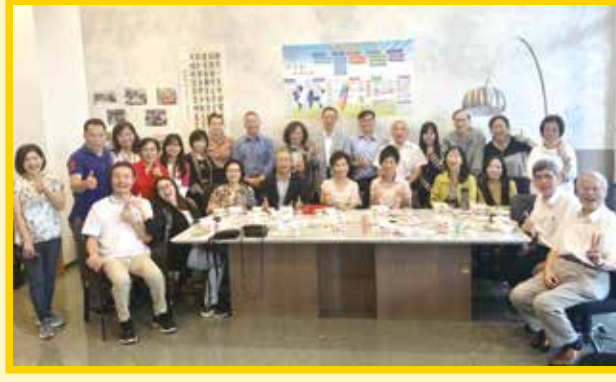
■10.25「在守謙有約~溫馨下午茶雲林日」