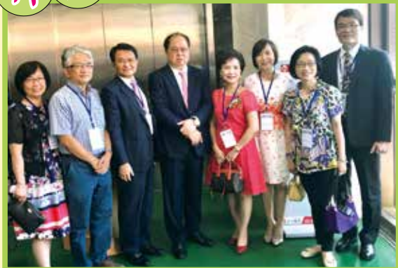
■10.12出席宗瑋工業博士廠落成典禮