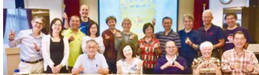
■樸毅校友會「樸毅44年會」合影

「淡江樸毅校友會」為103年由「淡江樸毅社會工作團」畢業之社會人士所成立，持續每年回淡江大學舉辦校友聯誼活動，本次活動為「淡江樸毅社會工作團」成立後第44年的紀念活動，於10月20日(日)於校友聯誼會館舉辦。