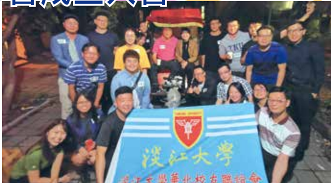
■淡江華北溫情烤肉趴合影