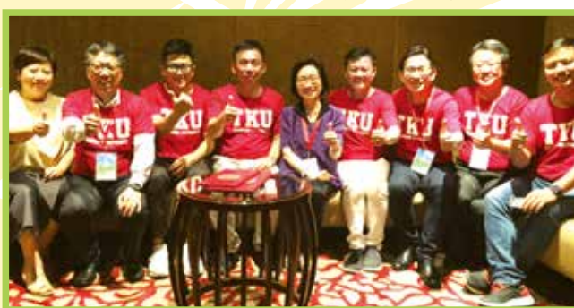
■10.26與東南亞校友會各會長合影