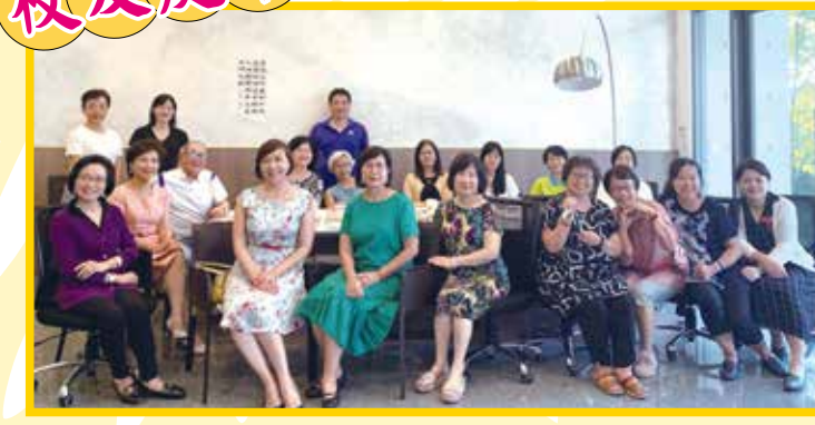
■10.04「在守謙有約~溫馨下午茶談水日」