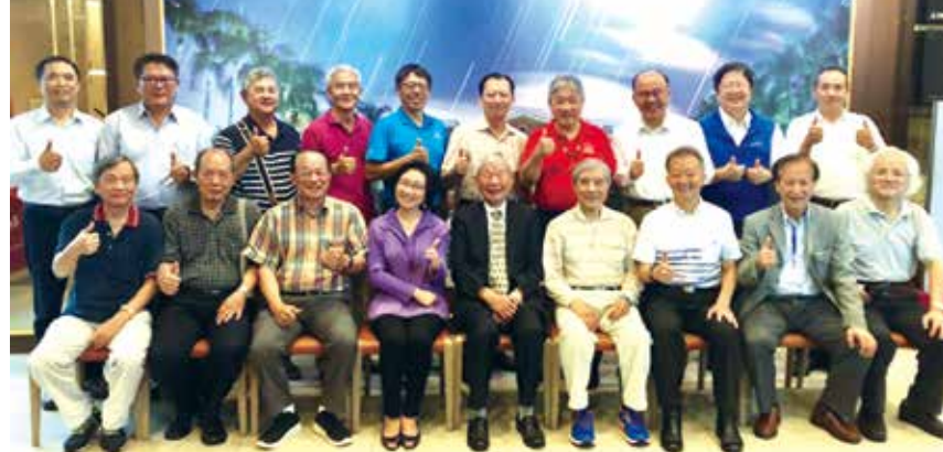
■航海系系友會師生餐敘合影

後因教育政策改變，航海系歷十屆而結束，商船學館改為現今之海事博物館，然而歷屆畢業系友於國內外各企業服務，均有極重要的貢獻，實為國家社會安定之重要力量。而每年教師節前舉辦師生餐敘，邀請歷年曾經教導的老師們與學生共聚一堂，以誌不忘師恩。