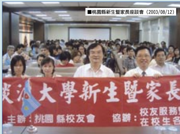
■桃園縣新生暨家長座談會（2003/08/12）