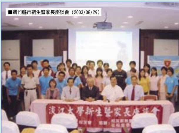
■新竹縣新生暨家長座談會（2003/08/29）