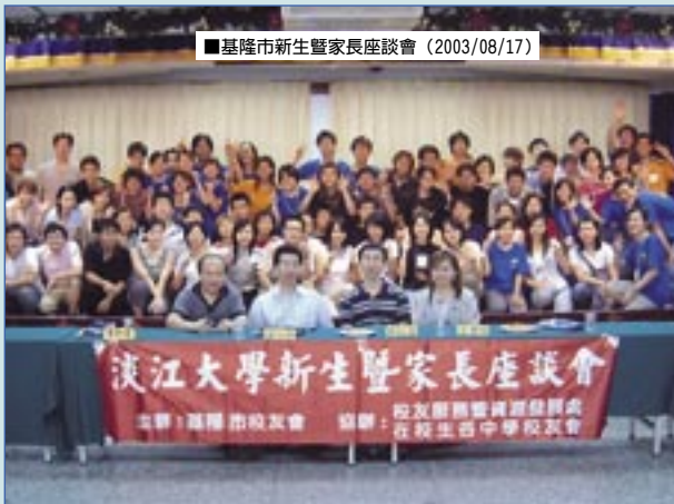
■基隆市新生暨家長座談會（2003/08/17）