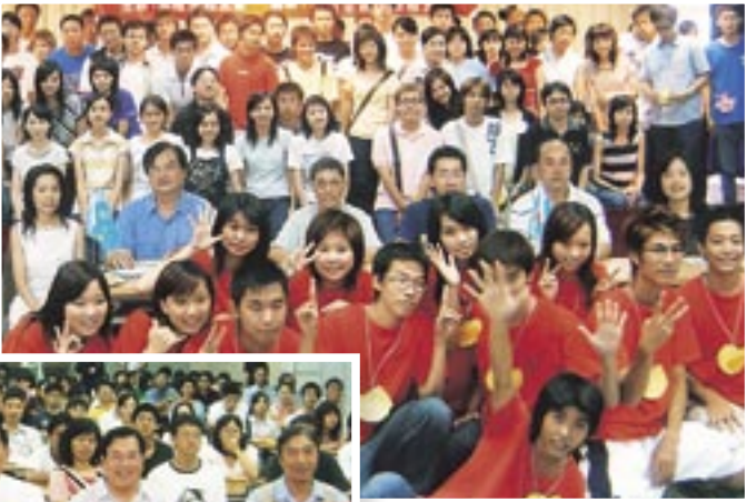
基隆市(2004/8/15，上)、台中縣市(2004/8/17，下)新生暨家長座談會。