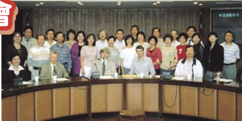
德文系畢業三十年同學與師長合影。