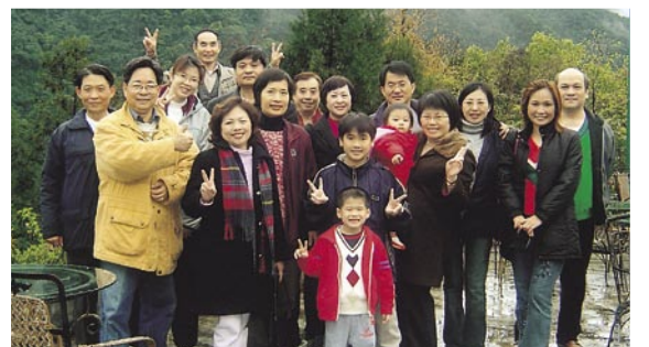
（夜）企管系友會舉辦烏來之旅（2005/2/27）

5月28日晚上在台北校園校友聯誼會館召開第9屆第7次理監事聯誼會。主要討論下屆會員大會相關事項，全體理監事出席，並訂在7月16日召開大會與選舉第10屆系友會理監事再推舉會長。