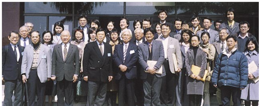
日研所邀請總統府資政辜寬敏先生與校友座談(2005/3/19)

3月19日日研所友會在驚聲紀念大樓601室舉辦所友聯誼會，日研所所長任耀廷藉此聯誼活動，邀請總統府資政辜寬敏先生蒞校演講「台日未來政經關係的展望」，辜寬敏先生談到從日治時代到現今社會，台日交流相當地頻繁；不論政治影響、經濟貿易、教育文化皆有相當密切的流通。此外，就目前台海關係的發展，間接影響日本在亞太地區的經貿地位，並分享自己的見解給日研所所友們。會後在觀海堂餐敘並募得基金10萬元。