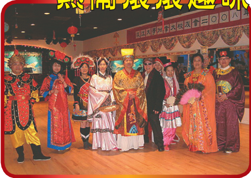
加拿大校友會2008年新春晚會擔任中國歷代服裝表演校友合影

加拿大校友會1月18日(星期五)下午6時30在列治文舉行新春晚會，共有近兩百位嘉賓校友參與校友會的年度盛事，校