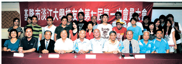
基隆市校友會第7屆第1次會員大會合影

比鄰基隆市別具歷史意義的忠烈祠及日據時代留下的古蹟建築,在濃濃的歷史味中,更激起校友回憶在母校的時光點滴;本次會議除了討論會內事務之外,更邀請校友踴躍參加母校60週年慶校活動,共同見證一甲子的榮耀。