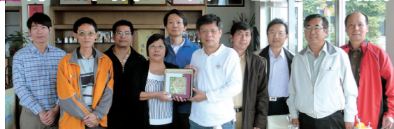
彰化縣校友會會議合影

彰化縣校友會4月24日(星期六)假彰化縣林鎮夜光高鐵餐廳召開第4屆第2次理監事會議,本次會議除了聯誼,增進校友感情,並增加2位新會員,最主要討論擬增加兩位理事及設置彰化縣淡江子弟清寒優秀獎學金事宜及理監事捐款金額,最重要鼓勵學長們於11月6日返校參加母校60週年校慶,會議於下午2時結束。