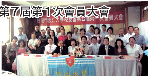
台南市校友會第7屆第1次會員大會合影

談會，今年座談會將由台南縣校友會主辦，台南市校友會協辦，地點選在台南縣永康市「台南商務會館」，因應台南縣、