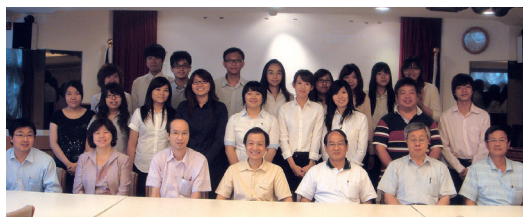
統計系企業導師制成果發表會合影

5組，每組都是由校友(Team Leader)、老師及在學學生所組成，校友會就本身學經歷等經驗教授業界的動向、求職求學的技巧，輔以系上老師的引導，讓每一組的學生都獲益匪淺。除了分組報告成果外，企業導師的意見回饋及系友意見交流等等，更加深了系所師生與校友的緊密結合，這對於系所未來成長及發展、校友對母系的向心力、認同感皆有非常正面的提升作用，活動在下午3時順利圓滿結束。