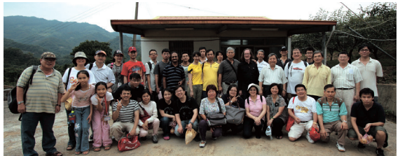
化材系同學會採果之旅合影