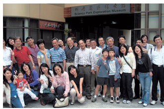
統計系系友會春遊-新竹科學園區探索博物館合影