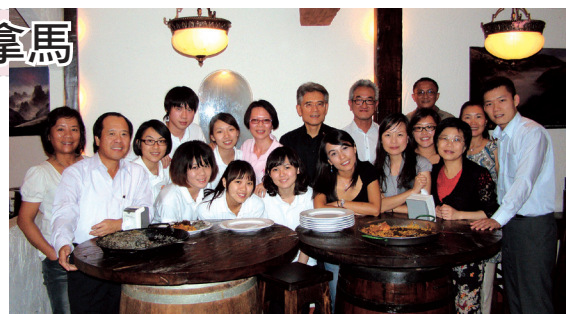
巴拿馬淡江大學校友會宴國際青年大使

會後淡江校友會致贈母校青年大使團成員巴國原住民手工藝品MOLA(為一種巴國KUNA族婦女製作之拼布藝術)，學弟妹們並以隊歌「你是我的花朵」舞蹈回饋校友會學長姊，並在柯大使及在場學長姊面前，練習演唱中文歌曲的西語介紹詞，餐敘在晚間十時左右結束。