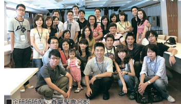
■企研所校友、眷屬聚會合影

日期：2010年9月4日（星期六）12時至17時 地點：淡江大學城區部五樓校友聯誼會館 聚會主軸：談心、關懷、分享