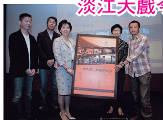
■「那些淡江教我們的事」淡江大戲首映發表。