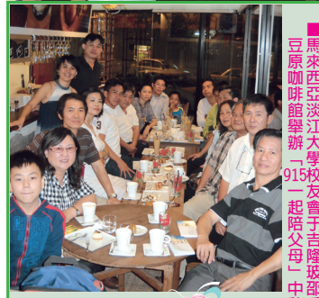
豆席咖啡館舉辦「915一起陪父母」中秋聯會