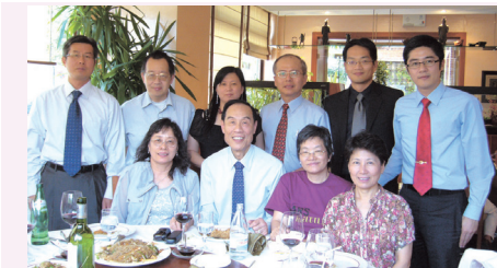
吳寬主任訪西，黃龍元大使及校友會校友聚餐歡待

事長（高雄縣市合併第1屆），會後舉行餐敘，高雄市長陳菊也現身餐會，為新任理事長祝賀。