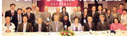
張校長家宜和獎學金贊助入合影留底