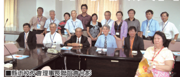
縣市校友會理事長聯誼會合影

縣市校友會理事長聯誼會於99年9月18日（星期六）下午2時假高雄縣議會3樓會議室舉行，會議由總會羅森