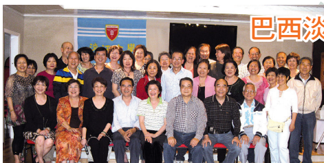
巴西淡江大學校友會歲末旅遊合影。