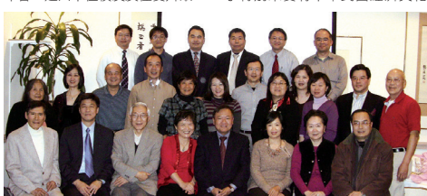
(美)首府(華盛頓D.C.巴爾的摩)淡江大學校友會理事會合影。