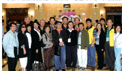
海外校友參加雙年會活動於金車酒場合影。

參加本活動的校友會來自海內外，包含北美洲校友會聯合會、南加州、北加州、美國首府華盛頓、加拿大、香港校友會、上海台商校友聯誼會、彰化縣、花蓮縣、高雄縣、屏東縣、台南縣等約一百三十人出席，藉由本活動聯繫校友感情。