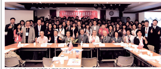
台北市校友會100年度獎學金頒贈典禮合影