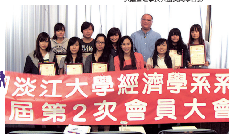
淡江大學經濟學系系友會第2次會員大會