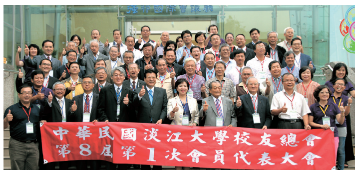
校友總會會員代表大會與會人員大合照（張邦國際會議廳）