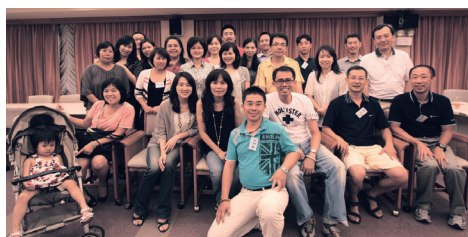
水環系EMBA同學會理監事會

活動當天準備了豐盛的歐式自助餐邀請所有同學共同享用晚餐。同學們互相問候分享著近況，氣氛相當輕鬆愉快。而生日蛋糕更是當天的重頭戲，一起歡度慶生後有個完美的結束。