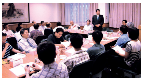
水環系系友會成立大會

慶祝活動下午於工學大樓演講廳安排產學及產業論壇，邀請有關化工及材料技術相關之系友，主講「台灣石化工業、生技產業現況與展望」、「高溫複合材料之應用」等題目，為系上師長和系友間搭起一個交流與合作平台。