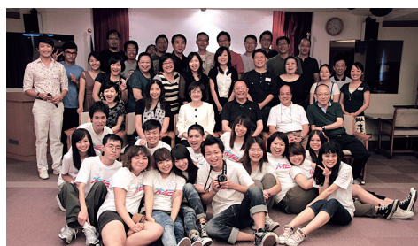
大傳系師長與系友大合照

此次同學會很難得邀請到許多久未見面的老師一起來共襄盛舉。令系友們驚訝的是，老師們現在的樣子竟然和校友求學時一模一樣，彷彿歲月都沒有在他們臉上留下太多痕跡。為了讓跨屆系友有交流機會，同學會也設計了小小的遊戲，讓各屆系友經由活動而彼此認識與互動。最後在一片互道珍重聲中，系友們期待明年再相逢。