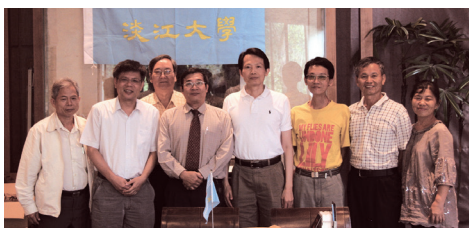
彰化縣校友會理監事會合影

獎學金得獎名單及臨時動議。會後隨即於會場餐敘，閒談彼此近況及生活、職場經驗分享等，會議約於下午1時圓滿結束。