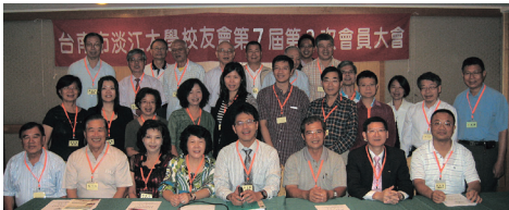
台南市淡江大學校友會第七屆第2次會員大會合影