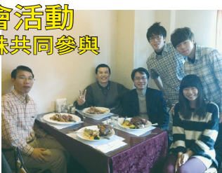
資管系系友會與會員合影

去年3月春之饗宴資管系邀集各屆校友舉辦家族溯源活動，一班一班的班級分組就像列車一樣，載著大家一起回憶在校時的點點滴滴，同時也一起航向新的活動，當天系友們分組競賽熱鬧非凡，更從中展現了資管系跨屆之間的好感情。