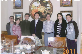
香港校友會探訪澳門校友餐敘及合影