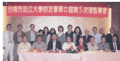
台南市校友會理監事聯席會合影

會議中討論到台南縣校友會合併之新組織章程、3月10日春季旅遊「北埔老街、綠世界生態農場一日遊及報名馬來西亞2012世界校友會聯合會雙年會活動等議題。其中春季旅遊將與高雄市校友會合併舉辦。會中並為當月壽星慶生，歡唱生日快樂歌，增添喜樂氣氛。