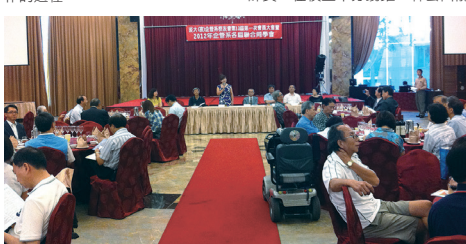
夜企管系系友會邀請靈會會長於大會中致詞

2008年，楊雅喆導演以華語電影少見的兒童題材及嶄新的視角，細膩詮釋與純真告別的《囡女孩》之後，他將創作焦點轉向人生永恆的難題——人與人間細膩幽微情感、世代的變遷、面對生活中的妥協、理想熱情的堅持與消失的兩難……《女朋友 男朋友》就是這些關注下誕生的最新創作。從男孩到男友，楊雅喆導演於6月24日週日講座與現場與會人員分享電影創作的過程。