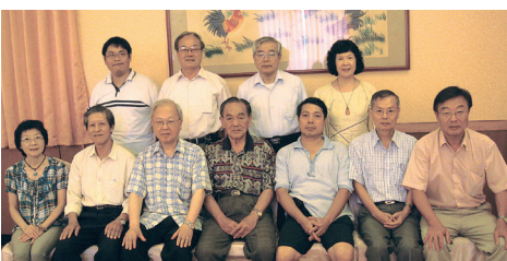
宜蘭縣校友會理監事聯席會議與會人員合影

添福接任,林理事長當選後,發表感言,他期望宜蘭校友會未來有更多校友加入,對於8月12日即將於宜蘭舉行的新生暨家長座談會也希望校友可以共同參與,歡迎學弟妹加入淡江人行列。