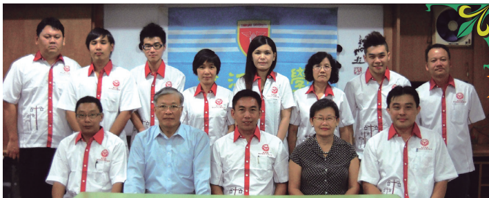
馬來西亞校友會雙年會籌備委員會合影