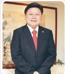
■花蓮縣縣長傅崐萁，施政滿意度第一，民調三連霸五星級縣長