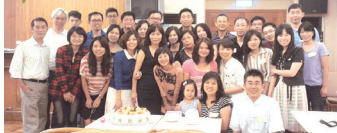
■企管系95 EMBA月華家族聚餐合影

每年1度的月華家族聚餐於9月15日(星期六)下午1時舉行，本次聚餐由第3屆負責辦理，以外爐及蛋糕慶生的活潑方式進行，家族成員利用這1年度之大集合認識與會的同家族成員，經驗交流分享近況，既溫馨又熱鬧，並於會後決議102年度由第4屆企管EMBA負責主辦。