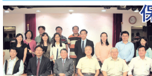
■保險系系友會第2次理監事會議合影

會中決議設立常年系友會獎學金、審核傑出系友、討論第4屆理監事及理事長、監事事宜並定11/3校慶當天於母校水牛廳舉行年度會員大會活動。