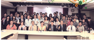
■(夜)企管系系友會第13屆第6次理監事會議合影

本次聯誼會特別邀約母校前主任洪英正博士前來專題演講，講題為「EQ與AQ」，決定服務與人生品質。專題演講，於輕鬆的言談中，讓我們獲得很大的啟示，真是獲益良多。