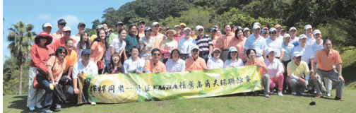
■北區EMBA青鷹高爾夫球聯誼賽開球合照

每3個月舉辦1次聯誼賽，10月14日由淡江大學EMBA高爾夫球隊主辦，比賽地點於老爺西高爾夫球場，聯誼賽目的以聯繫跨校EMBA學員們的情誼、資源交流為主。