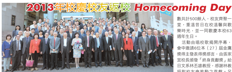
■2013年校慶校友返校Homecoming Day合影

會中,如往例由EMBA碩專班10組隊伍,於當日舉行才藝爭霸大賽,所有參與的學生皆卯足全力。最後,由企管碩專班,以整齊劃一的演出拔得頭籌,第2及第3名,分別為國商碩專班及管科所碩專班奪得,活動的創意表現、團隊凝聚力及榮譽感,讓在場的師生、校友感動不已。