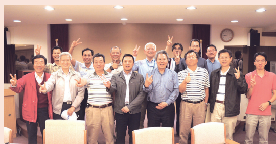
■電機系系友會理監事聯席會議合影

電子與電機系友會於4月16日(三)下午6時30分，舉行第13屆第3次理監事聯席會議，會中通過推選第28屆「淡江菁英」金鷹獎候選人。另外，系友會於4月20日(日)舉辦陽明山登山健行活動，並邀請在場理監事能共襄盛舉。