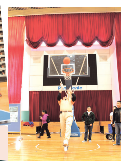
■籃球背對籃框投籃趣味競賽