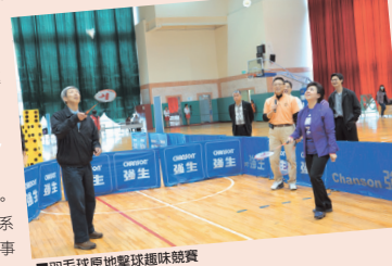
■羽毛球原地擊球趣味競賽