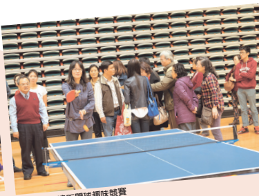
■乒乓球遠距離開球趣味競賽