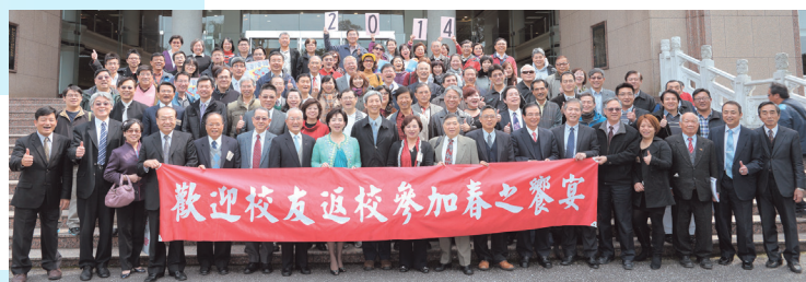
■春之饗宴校友返校全體校友合影

凡淡江英專、文理學院及大學之校友，具有高尚之品德，對國家、社會、人群及母校卓有貢獻者，皆具有候選資格。詳細活動訊息母校已發公函及寄發電子郵件予各校友會會長、理事長，並在母校校友服務暨資源發展處網頁( http://www.f1.tku.edu.tw )公告，凡符合資格者或欲推薦校友參與選拔者，請與海內外各校友會連繫，並請依規定備妥相關資料，以利審查。(承辦人：母校校友服務暨資源發展處謝雅陵小姐，電話：02-2351-5123)