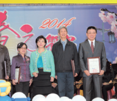
■春之饗宴校長與系所友總會授獎後合影

而系所友會聯合總會亦頒發第2屆傑出系友獎，獲獎者是由各系所推薦的優秀校友共46名，包含大傳