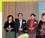
■春之饗宴校長與捐款人合影