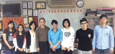
■基隆市校友會就業講座合影

對薪水有合理的期待、具備良好的態度、學會求職（履歷、面試）的技巧。在演講中學姐也指出母校在企業界中有極高的愛用度，除了態度積極主動外，淡江人的學習力很強，希望學弟妹們能繼續保持並發揮淡江人的優良傳統。