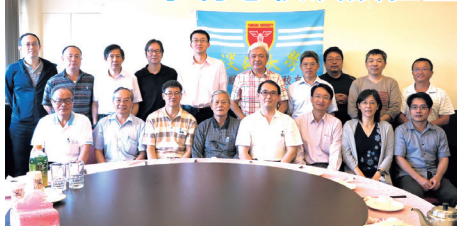
■金門縣淡江大學校友會第5屆第1次會員代表大會合影

金門縣校友會於5月24日（六），假金門縣東門餐廳舉辦第5屆第1次會員代表大會，會議由李有忠理事長主持，母校張家宜校長及中華民國校友總會陳定川理事長均致電表達祝賀。本會議，除原會員外，更增加許多年輕校友出席，計約30人參加。