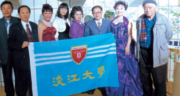
■樂活學苑日語歌謠聯誼會於日本電台卡拉OK大會合影

樂活學苑日語歌謠聯誼會3月19日（三）應日本埼玉市電視台邀請參加春季卡拉OK大會，獲得甚高的評價。