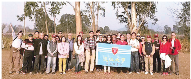
■香港校友會郊遊活動合影

賞風景。此為無線電視古裝劇拍攝場地，最後，沿河邊觀賞蘆葦及候鳥。晚上，返回元朗市享用風味盆菜，飯後校友們意猶未盡，再到元朗著名的「仔仔涼粉」吃甜品，大家都盡興而歸。