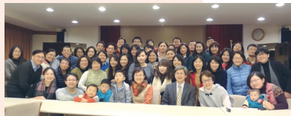
■課程所高家班同樂會合影

高教授以多元方式指導，讓年輕到年長的校友都能發揮所學和專長。亦有很好的表現，校友中，包括有教育局科長、校長、教務主任、教學組長等，桃李滿天下，彼此學習，歡樂相聚。