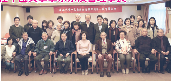
■中國文學系系友會第3屆第1次會員大會合影

系友會將配合中文系創系60週年，出版系友會會刊及舉辦系友及教師藝文展，希望在一屆理監事的共同努力之下，能對系友及母系有所貢獻。