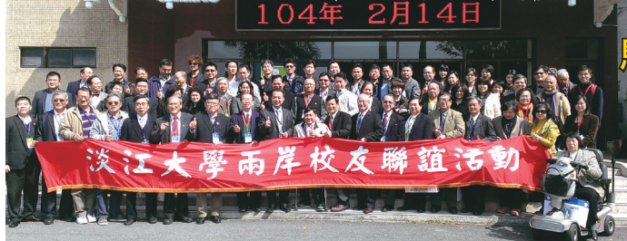
■台北市校友會104年兩岸校友聯誼活動合影

台北市校友會曾於去年5月，組團訪問大陸廣東校友會，親身體驗校友在大陸經營企業的成就。8月底決定於春節前一週辦理兩岸校友聯誼活動，並決定由台北市校友會主辦，校友總會卓越校友聯誼會協辦。