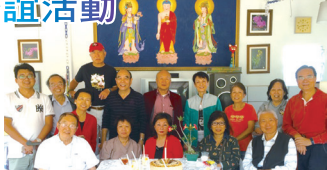
■巴西校友會校友聯誼合照

11月，在巴西已入夏，聖保羅風調雨順、氣溫是攝氏19度到23度的怡人氣候，學長農場有三個大的培育房，琳瑯滿目，他們很細心的陪校友們一間間的介紹說明，還特地準備在地新鮮桃子、蓮霧、各式飲料，請大家品嚐。校友們也帶來家鄉風味，大家笑談古今，其樂融融！最後，因有些校友擔心天黑迷路，雖意猶未盡，只好踏上歸途，期待下次再見！