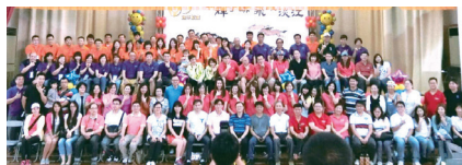
■企管系EMBA系友團聚合影

企管系於104年11月8日(日)上午，在淡水校園舉辦校慶活動-「淡江大學企管系EMBA系友運動聯誼會」。報名參與人數約260人，歷屆93至102級畢業之EMBA系友皆有代表出席參加。此次聯誼會圓滿落幕，成功凝聚EMBA系友對於系上的向心力，也對於企管系之經營產生多層面的綜效影響。