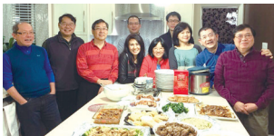
■加拿大校友會理監事會議及聖誕聚餐

本次會議主要是討論會務及2016年的新春聯誼活動，連同眷屬共有16人參加。會中決議，2016年新春聯誼活動訂於1月24日(星期日)上午11時，在列治文Mayfair Lakes Golf & Country Club舉行。將採用西式自助餐方式，大人收費每人美金30元，12-18歲小孩酌收美金10元，餐費不足部分由校友會支付。理監事及顧問提供摸彩禮物，歡迎校友共襄盛舉。