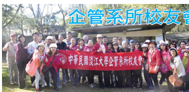
■企管系所校友會登山活動合影

104年12月5日(六)上午，企管系所校友會舉辦自強活動【桃源山谷賞楓一日遊】。本活動與台北市校友會合辦，還特別邀約母校外籍生同遊，讓他們體驗台灣的好山好水及民俗風情。行程包含桃源谷賞楓行程、大溪老茶廠導覽、參觀製茶過程及歷史、大溪老街巡禮、品嘗古早味小吃。