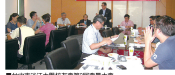
■台中市淡江大學校友會第2屆會員大會

台中市校友會於104年11月22日(日)下午4時，假中區市公20樓會議室，舉行台中市校友會第2屆會員大會。