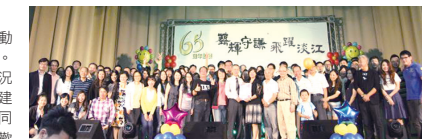
■管科系博士班返校活動

管科系於11月7日(六)下午5時，在淡水校園活動中心舉辦「博士班40週年慶祝暨系友返校晚宴」。系友及眷屬約500餘人參加，其熱烈參與度可謂盛況空前。本次活動邀請張前校長銘炬、商管學院邱建良院長致詞，系主任曹銳致詞後邀請大家舉杯同賀淡江大學65週年及管科博士班40週年，系友們歡聲雷動，同感欣幸。在一連串的表演活動後，推出40週年大蛋糕，於歡聲中為活動畫下完美句點。