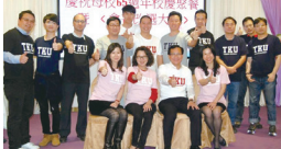
■香港校友會慶祝母校65週年校慶聚餐合照

香港校友會於104年11月28日，假尖東百樂門宴會廳，舉辦慶祝母校創校65週年聚餐暨會長改選大會。