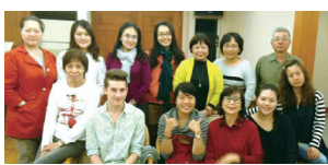
■法文系友活動後合影