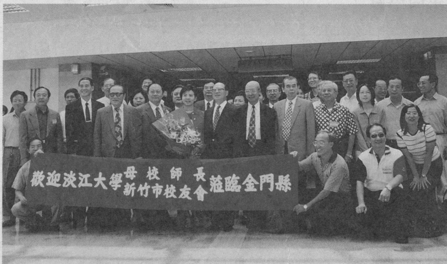
■金門縣校友會歡迎母校師長暨新竹市校友會蒞臨金門參訪。