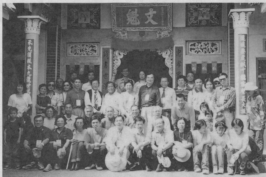
■高雄縣市與屏東縣校友會，合辦美濃「進士第」聯誼。