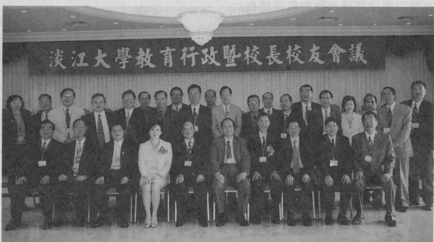
■教育行政暨校長校友會議在淡水校園舉行。