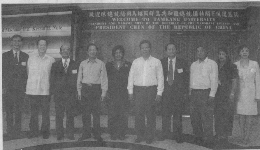
■馬紹爾群島總統諾特伉儷由陳總統水扁陪同，到淡水校園參觀，張創辦人建邦（左三）、張校長紘炬（右四）、張副校長家長（右一）、馮副校長朝剛（左一）等人熱誠歡迎。