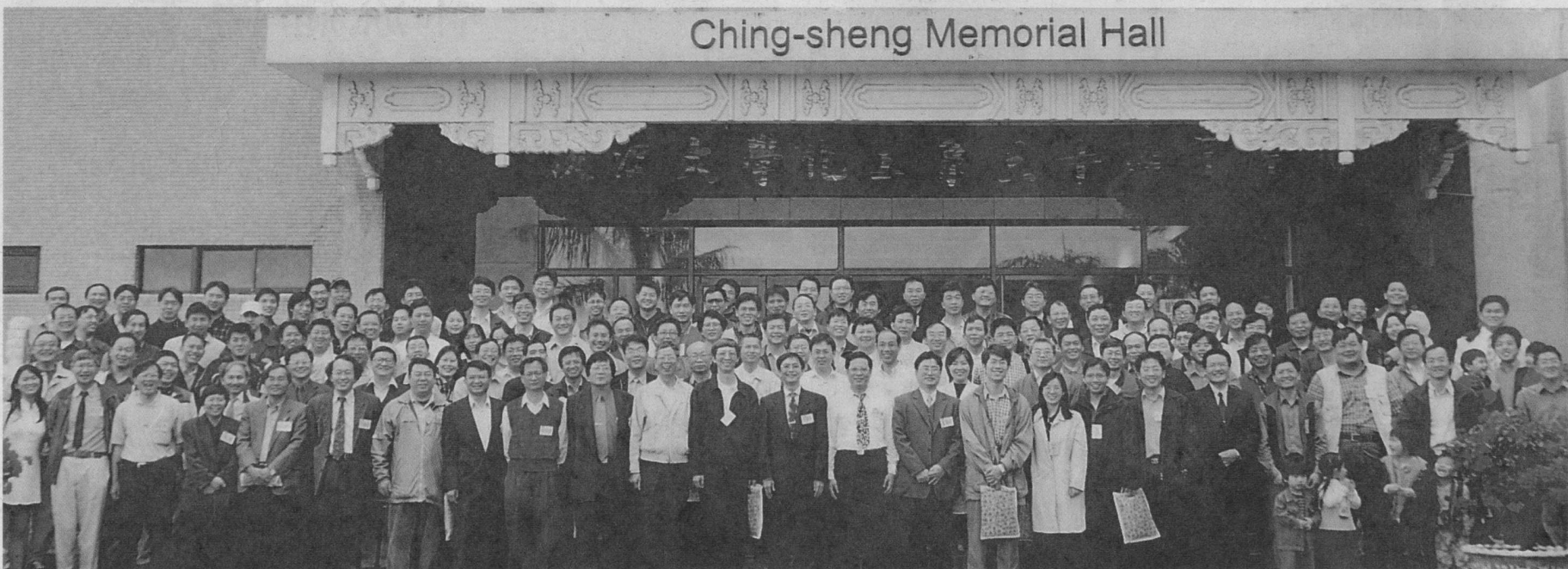
■化工系創辦30週年，系友返校慶祝並聯誼。