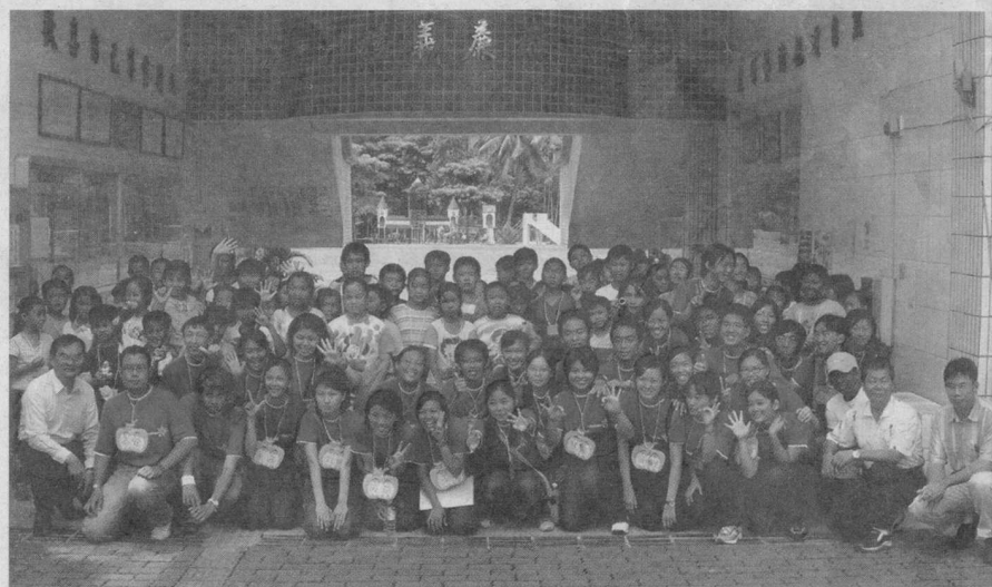
■高雄縣校友會返鄉服務隊與甲仙國小同學「一拍即合」。