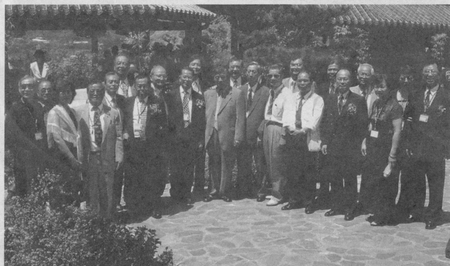
■91年6月8日校友參觀新近落成的「覺軒」花園。