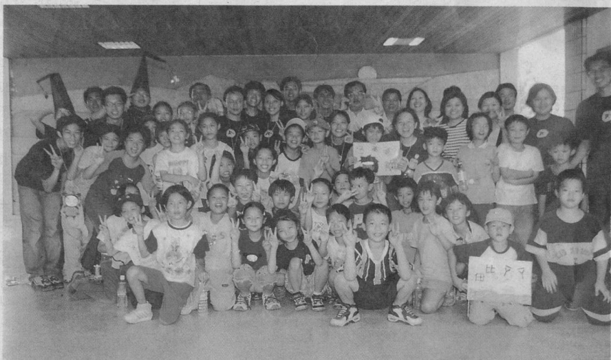
■屏東縣校友返鄉服務隊與長治鄉繁華國小同學同樂。