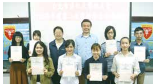
■台北市校友會第同心獎學金頒贈典禮，受獎學生採分流方式分梯報到與受獎。

同心獎學金已舉辦數年，累積高達71位受惠同學，多位同學在校表現優異，舉凡課業、社團生活、人生規劃上皆然。這群同學平時踴躍擔任校友會的各項活動志工，深受學長姐和贊助人們的肯定，畢業後在職場上的表現也深受企業主的喜愛與讚賞。同學們能有如此優秀的表現，背後支持的力量最要感謝的就是長期以來對本會公益平台持續贊助的學長姐們，帶著您們的鼓勵，學弟妹們成為台灣未來的棟樑和希望是指日可待的，再次感謝所有的贊助人。