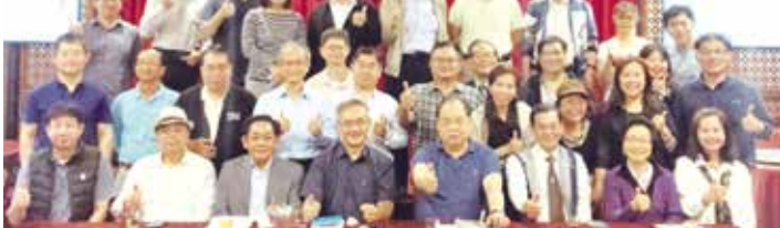
■高雄市校友會第24屆第6次理、監事聯席會議暨春酒合影

林總會長於致詞時表示，今年11月7日欣逢學校創校70週年慶，將於11月6日(五)舉辦總會的會員大會(由新北市校友會主辦)。楊執行長表示，學校原訂於3月21日(六)舉辦的春之饗宴活動，因疫情取消辦理。特別邀集校友於11月7日(六)參與母校「淡江70從心超越」校慶活動之「校友市集」設攤，地點在守謙國際會議中心大樓外圍。