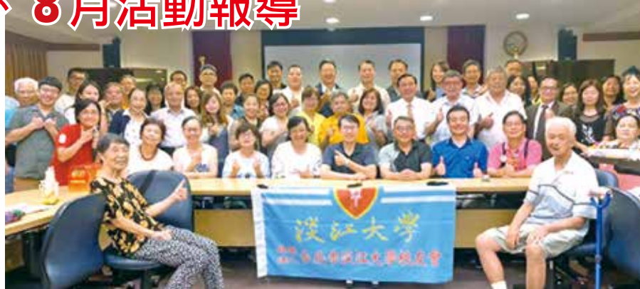
■台北市校友會7月份主題演講及慶生會。

另於7月11日(六)及8月8日(六)上午，分別舉辦新北市雙溪虎豹潭及四獸山健行活動，活動參加人數皆非常踴躍，這要感謝多位志工的規劃與協助，讓活動能順利舉辦。