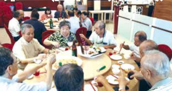
■嘉義縣校友會第12屆第2次會員大會餐敘現場。

副總會長蒞會指導。本次會員大會配合嘉義場109學年度新生暨家長說明會的召開，會出席非常踴躍，也協助說明會相關工作。會中討論108年度會務工作報告、經費收支決算審議外，並討論109年度工作計畫、經費收支預算。會中並決議將組團出席總會會員代表大會及參加11月7日母校校慶系列各項活動，討論熱烈，圓滿完成。