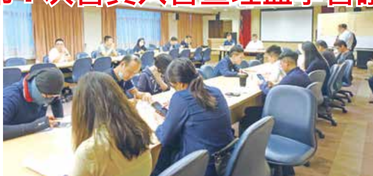
■運管系系友會第1屆第1次會員大會暨理監事會議選舉現場。

會議中，主要進行第1次理監事選舉，介紹本屆幹部群及系友動態，讓系友會理監事們更了解系友會得活動及運作。會議結束後，邀請歷屆系友至台北銀翼餐廳進行晚宴，也積極向系友進行募款，期望明年系友會成立35週年可以擴大舉辦，並能積極與系上共同合作，辦理各項學生與業界實務接軌之活動，貢獻所長。