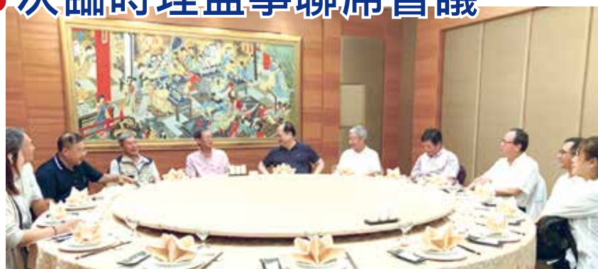
■澎湖縣校友會-第7屆第3次臨時理、監事聯席會議一景

中午餐敘後大家一同參加109學年淡江大學新生暨家長座談會澎湖場，共同勉勵新生，並歡迎新生加入淡江大學大家庭。