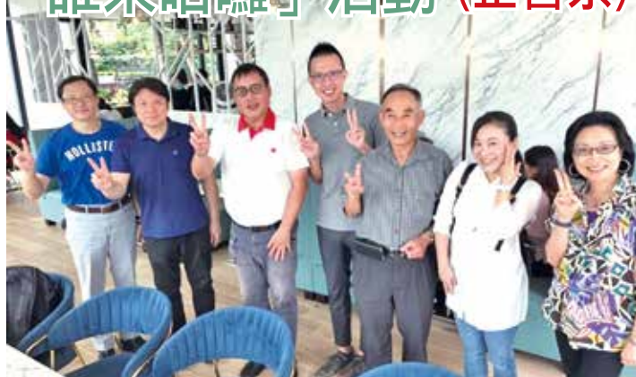
■第五場「誰來哈囉」會後於布納咖啡館合照。

在大家的腦力的激盪下，關於企管系的歷史、政策及現在的發展及對校友會該如何配合系所校務的推動，達成許多的共識。當日活動在歡快的氣氛中結束，與會者一同豎起大拇指結束這美好夜晚。