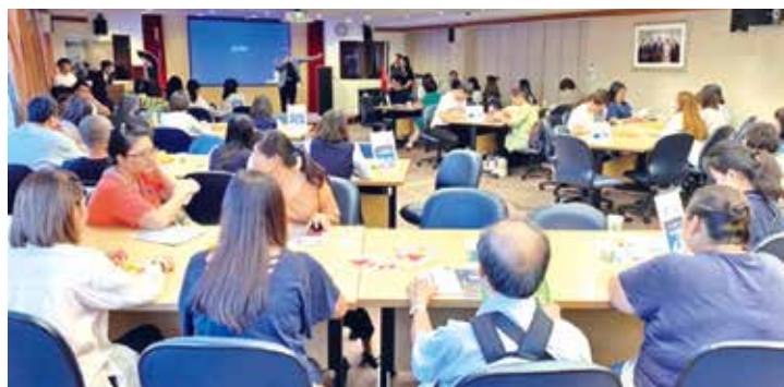
■淡海同舟校友會後疫情時代的旅遊趨勢演講活動，參加者眾。

演講中張主任強調第一印象很重要，說明透過外表、行為舉止，甚至口頭禪均有助於了解對方的心理狀態，尤其表情比聲音和語言來得重要，所謂「左臉真心、右臉撐場面」，臉是心靈之窗，表情會隨著內心狀態而變化，所以要懂得察言觀色。這是一場深入淺出，幽默風趣，理論與實務兼具的精闢演講，與會學長們都覺得收穫滿滿。感謝張系主任精彩的分享！