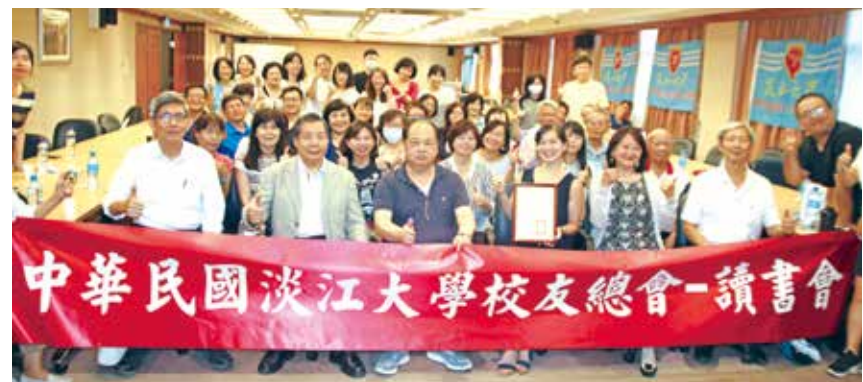
■中華民國校友總會讀書會講座合影。

本次會議後各縣市理監事用餐並互相討論相關會務經營，林理事長同時預告8月在各縣市所舉辦的新生家長座談會可以跟在校生校友會結合，也期許在11月7日配合母校70校慶所舉辦的會員代表大會，各縣市也能揪團一起回母校走走。