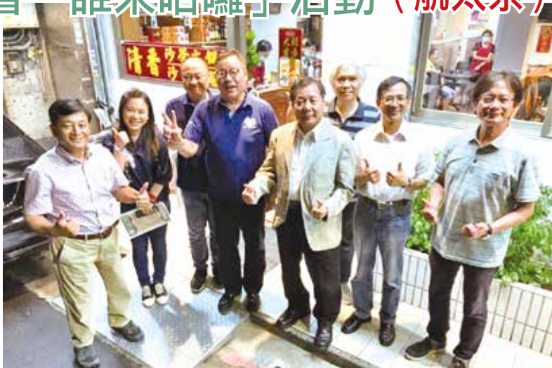
■航太系「誰來哈囉」會後於清香廣東汕頭沙茶火鍋前合照。

席間大家並以國內新成立的星宇航空為例，討論到這幾年航空界，無論是創業理念、佈局、策略和待遇，均讓人耳目一新外，也更瞭解該領域的專業精神和服務熱忱。2020年受到疫情的影響，全世界的航空業均受到重創，這也影響到航太系從事相關產業的校友們，更直接打擊到整個觀光交通產業，目前也不知疫情何時才能平息？莊總會長表示，危機通常也意謂著轉機，希望大家都能共體時艱，好好度過這困頓的一年。