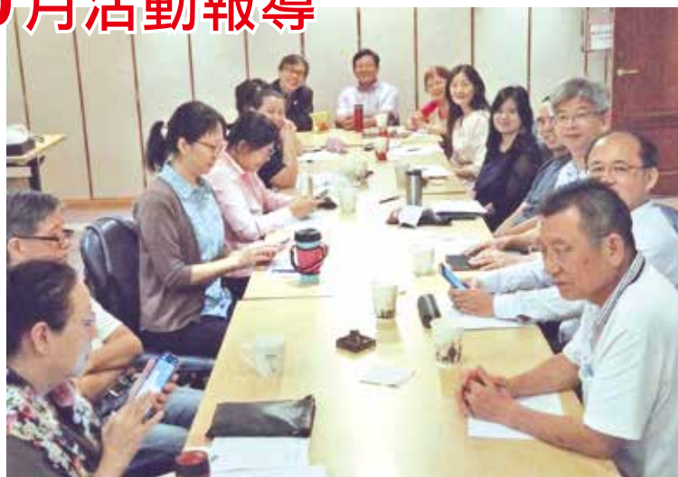
■日文系友會讀書會實況。(日文系友會提供)

每個月固定一次的讀書會，除了藉由求學時代學習過的日文增加知識，更重要的是連絡系友之間的情誼。來自不同領域不同級別的系友，彼此交流人生經驗，無形中也豐富了自己的視野。