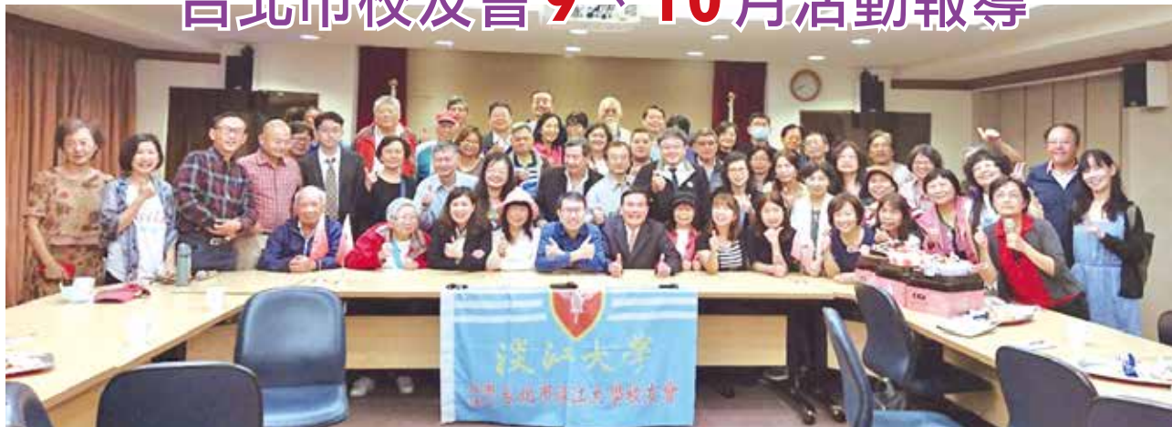
■台北市校友會9月份主題演講及慶生會合影。

台北市校友會於9月18日(五)及10月16日(五)晚上7時，在台北校園校友聯誼會館舉辦9、10月份主題演講及慶生會；另外亦於10月27日(二)晚上7時，於同處舉辦第11屆第3次理監事聯席會。