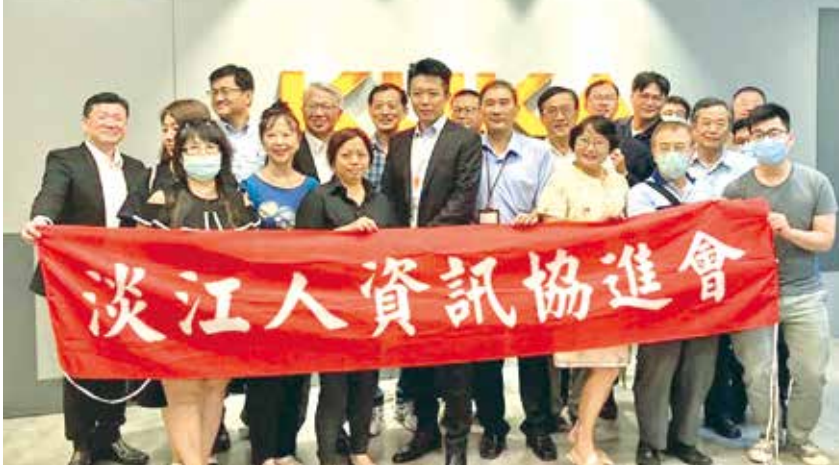
■淡江人資訊協進會於台灣庫卡機器人公司合影。

淡江人資訊協進會於9月1日(二)，到台灣庫卡機器人股份有限公司(KUKA AG)進行企業參訪，活動順利完成。特別感謝台灣庫卡給予詳細熱情的解說與實機展示，展現出德國高超的技術與工藝水準。同時也感謝各位學長姐熱烈的參與，未來如果需要機器人自動化可與專業的KUKA聯繫，尋求合作商機。