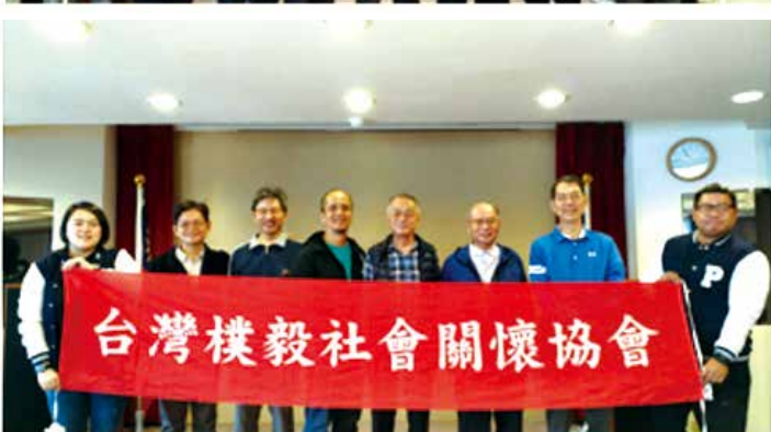
■樸毅校友會-工作團合影。

「樸毅校友會」於10月24日(六)上午9時，在台北校園校友聯誼會館，舉行了「樸毅45·我是樸毅」及「樸毅關懷協會10周年」團慶活動。橫跨近40年世代的樸毅人相聚一起話家常、聊著回憶、談論社會狀況、下一波「鷹揚計劃」的服務方向、內容及對未來社會企業的構想，另外也對明年樸毅46的團慶活動討論活動構想與展望不久即將到來的「樸毅50」。