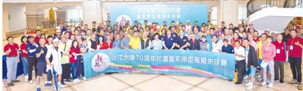
■系所友會聯合總會2020校慶暨系際盃高爾夫球賽合影

欣逢70週年校慶，系所友會聯合總會與母校體育處聯合主辦「淡江大學70週年校慶暨系際盃高爾夫球賽」，並由中華民國校友總會與母校校友處聯合協辦，於9月27日(日)上午在林口美麗華高爾夫俱樂部進行校友揮桿同樂，多達144位校友報名參與賽事。