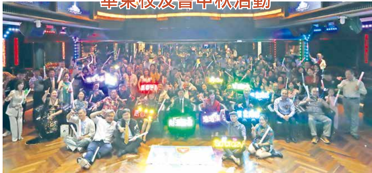
■華東校友會於上海百樂門就店歡度中秋。

華東校友會於9月19日(六)，邀集200多位淡江校友、兩岸高校台青、台商菁英們齊聚在擁有八十年歷史的上海百樂門，在中秋佳節前夕共同聚會，更重要的是大家分享在疫情過後的工作狀況及心情，期勉淡江華東校友們未來都能齊心協力、互信互助，共同攜手尋找新際遇。