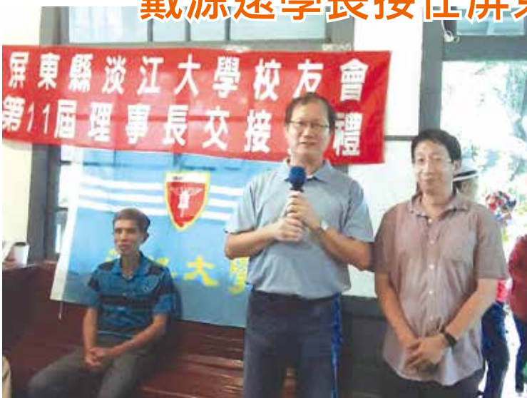
■屏東縣校友會第11屆理事長交接典禮。

屏東縣校友會於9月5日(六)上午10時，在屏東市紅館美食餐廳召開第11屆第1次會員大會。會議邀請中華民國校友總會林健祥總會長與王新財副總會長、高雄市校友會高銘陽理事長、校友服務暨資源發展處彭春陽執行長等貴賓出席與會。