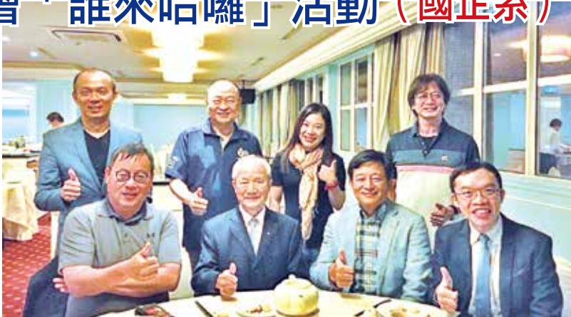
■國企系「誰來哈囉」於圓山聯誼會合影。

莊總會長表示，希望透過誰來哈囉活動，可以媒合各系所與校友會，讓不同世代的校友們互相溝通與學習，進而解決問題或是分享經驗，這也是我們建立這個平台的初衷。