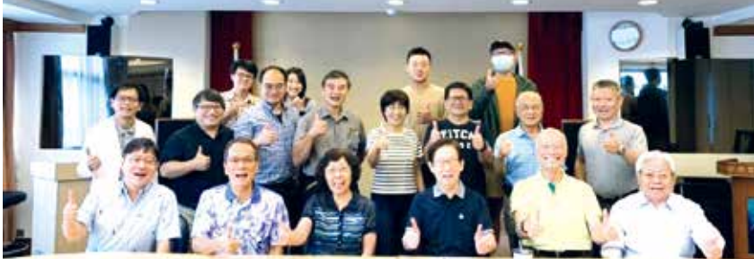
■水環系系友會會於大會合影。

支持母系幫助學生，提供系友會獎學金，傳承系友幫助在學學生得實質幫助，最後由理事長談論相關於自己的人生哲學學界經驗供給系友和學弟妹參考，氣氛融洽並溫馨圓滿。