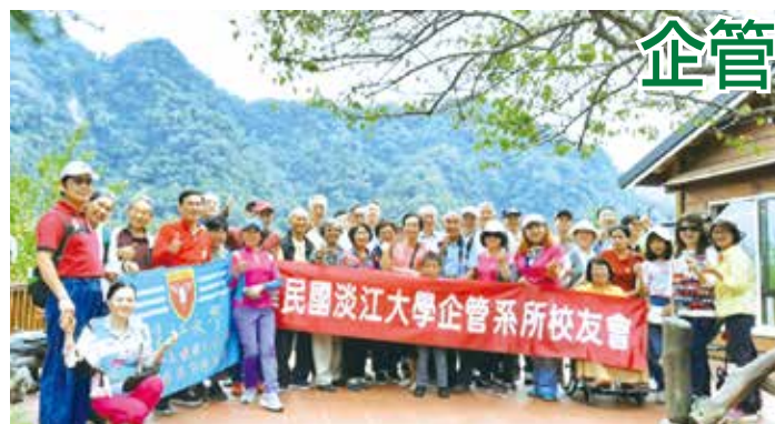
■企管系所校友會在杉林松境團體照。

席間大家並以近年來發展史為例，討論到這幾年無論科技和資訊都瞬息萬變，無論是、策略佈局、行銷手法和大數據的影響之下，人們的消費習慣和生活模式發生相當大的轉變。以至於為何校方會在鋪成16年之後，一口作氣讓未來學成為淡江發展項目之一，據聞2020年之後校方甚至會將兩個院所結合未來所做一個更為進階的辦學項目，也希望未來所能成為全球未來學研究的主要機構之一。