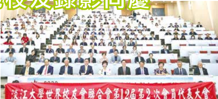
■世界校友會聯合會第12屆第2次會員代表大會於109年11月7日在守謙國際會議中心有蓮廳舉行。

大會最後以PPT方式報告世界校友會聯合會今年支持母校大型校友活動、參加中華民國校友總會、系所友會聯合總會各項活動籌辦、支持AI創智學院籌設、2022年印尼預計雙年會籌辦情形，校友也相約下次活動再相見。