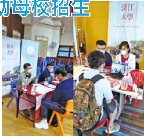
■香港校友會於台灣教育展協助招生。

香港校友會於109年11月14日(六)及22日(日)上午11時至下午5時，連續兩個周末，參加台灣各大學香港校友會總會所舉辦的兩場台灣教育展，由於疫情關係母校未能派員來港。慶幸得校友們到會場母校的攤位幫忙及母校國際處鼎力相助，透過網絡與母校連線，即場解答學生們的問題及提供各學系最新的資訊。教育展得以順利舉行及圓滿成功。