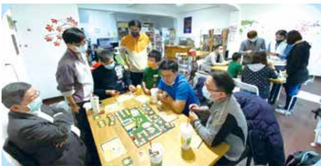
■桌遊大賽現場實況。(基隆市校友會提供)