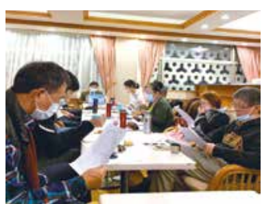
■日文系友會讀書會實況。

日文系友會分別於109年11月26日(四)及12月23日(三)晚間7點，於校友聯誼會館舉行了兩場「事事如意讀書會」。這兩個月的讀書會，援例由日文系彭春陽教授擔任導讀。11月的閱讀文章為文化相關的短篇，內容主要探討日本的榻榻米文化。12月則是應景的聖誕節散文。作者為日本知名畫家竹九夢二。內容描寫大正時期兩個孩童在教育方式截然不同的母親教育下所呈現出的對於聖誕節的期待與價值觀。適逢聖誕節前夕，會長特別準備了蛋糕等點心讓大家一邊學習一邊感受過節氣氛。每個月固定一次的讀書會，除了藉由求學時代學習過的日文增加知識，更重要的是連絡系友之間的情誼。來自不同領域不同級別的系友，彼此交流人生經驗，無形中也豐富了自己的視野。