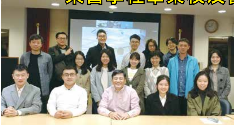
■榮譽學程畢業校友會籌備會於校友聯誼會館合影。

彭執行長表示，榮譽學程的優質課程，為學生打造更良好的學習環境。為持續提升學校的優質教育資源，葛煥昭校長特別指示成立榮譽學程畢業生校友會，讓散布在海內外各地、各領域的校友，能彼此熟悉認識並團結發展外，同時也為在校學生提供學習典範。