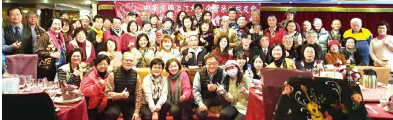
■企管系所校友會第4屆第2次會員大會合影。

大學部的成立宗旨，在培養數學、統計及相關科學應用與研究人才，提供全校學生基礎數學與數學通識之課程，並經由數學學習培養學生思考、組織、分析與表達之能力，提供數學專業理論、應用數學、統計分析及數據科學實務的訓練。近年的AI大數據崛起，讓各系所的專業想藉由趨勢來彙整進化，但是整個演算跟計量的起頭，需由數學系這邊來進行設計運算。未來的發展，將有數學系的頂尖人才發揮所長，一同打造新時代！