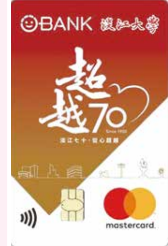
■淡江大學認同卡卡面，以張炳煌書寫的70週年校慶LOGO為設計。

本校與王道銀行於109年12月25日在鷺聲國際會議廳，由校長葛煥昭與王道銀行總經理李芳遠進行簽約儀式，共同合作推出「淡江大學70週年認同卡」。未來認同卡每筆消費金額，將有0.2%現金回饋學校、0.8%回饋持卡人。