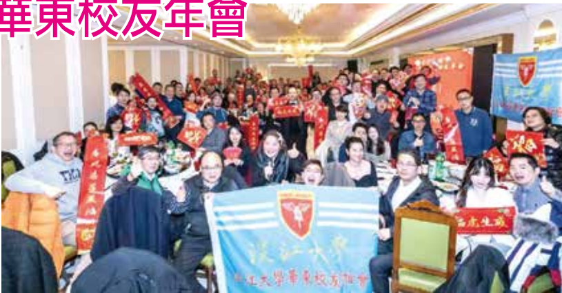
■2022虎虎生威，淡江華東校友年會

本次活動可說是有吃、有喝、有玩、有摸彩，桌面美食中出現了台灣薑母鴨、海瑞貢丸、台式香腸，一口口台灣味，一份份思鄉