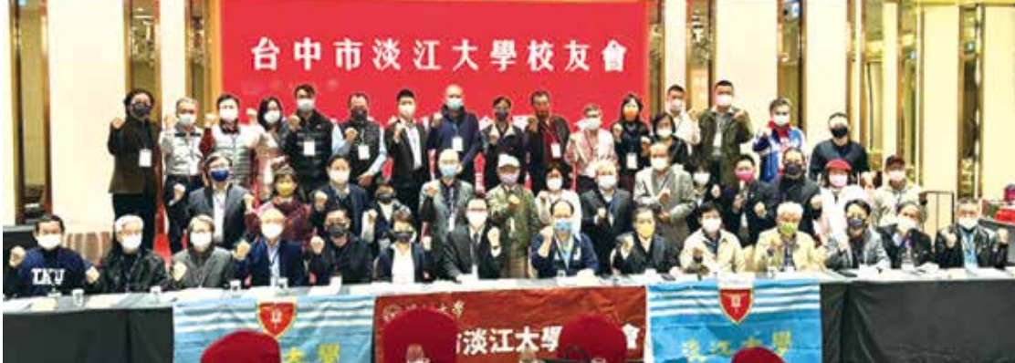
■台中市校友會第5屆會員大會暨第1次理監事會議暨尾牙聯歡合影

日邀請校友總會林健祥總會長、陳滄江副總會長、許孟紀副總會長、許義民秘書長、菁英會江誠榮會長、校友處彭春陽執行長、台中市校友會林敏霖榮譽理事長、洪義濱名譽理事長、廖述嘉輔導理事長、校友會全體會員及外縣市校友會理事長，如嘉義縣李賢勇理事長、高雄市陳點樹理事長等，多位貴賓親臨會場，當日特別嘉賓「菁英校友-台中市長盧秀燕學姐」，讓大家倍感榮幸。