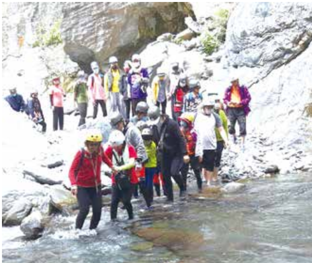
■高雄市校友會哈尤溪之旅側拍

2月18-19日(五-六)哈尤溪之旅，於110年11月策劃，12月完成報名。開始溯溪的冒險旅程，一路相互扶持，全團34人走完全程，當看到七彩岩歡聲四起，大自然的造景真美，大家都帶著美好回憶回家。