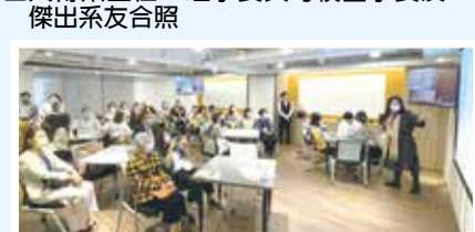
■日文系咖啡香中憶林不雄恩師透過照片追憶側拍