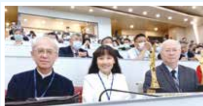
■中文系友會理事長與傑出系友合影