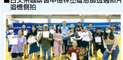
■俄文系友羽球聯誼賽合影