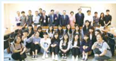
■公行系友回娘家暨獎學金頒獎典禮合影