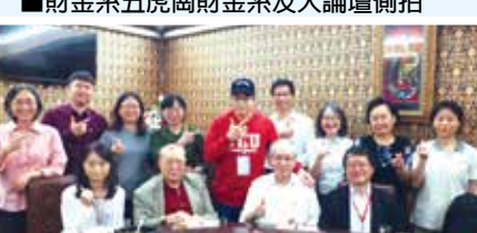
■產經系友回娘家合影