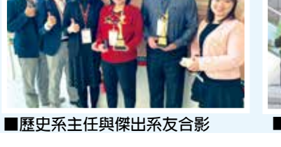
■歷史系主任與傑出系友合影