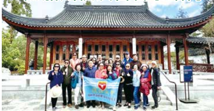
■南加州校友會春季踏青合影

了佔地11.5英畝的流芳園中的筆花書房、望星樓、集賢院和環翠閣等景點。大夥兒對於這座號稱中國以外，全球規模最大的中式庭園，無不豎起大拇指，還有盛開的櫻花、搭配浪漫的垂柳及湖中的倒影可謂美不勝收。