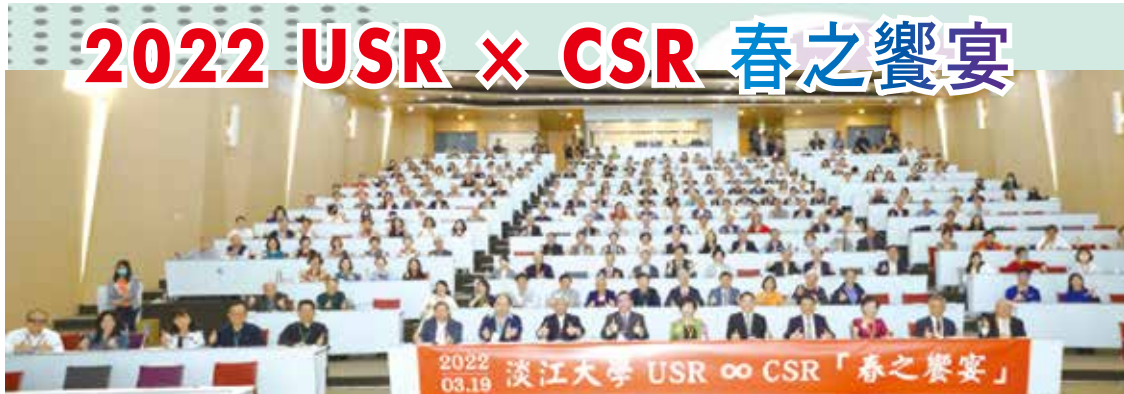
■2022春之饗宴合影

今年「春之饗宴」校友返校活動，於3月19日(六)在守謙國際會議中心有蓮廳舉行，包含頒發65位獲傑出系友獎、表揚捐款30-50萬的校友與企業及全球唯一∞玻璃藝術品揭幕儀式外，校友處及系所友會聯合總會與永續發展與社會創新中心共同舉辦「壯世代」演講、USR×CSR淡味創生知行學、USR計畫主題體驗等，活動相當豐富多元。