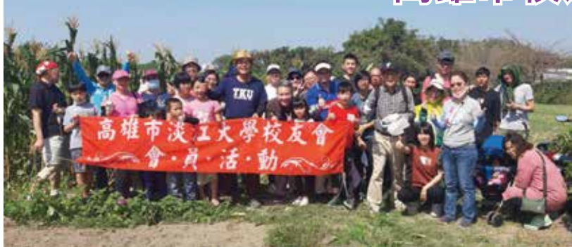
■高雄市校友會採果樂合影