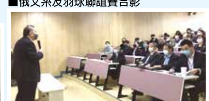
■財金系五虎崗財金系友大論壇側拍