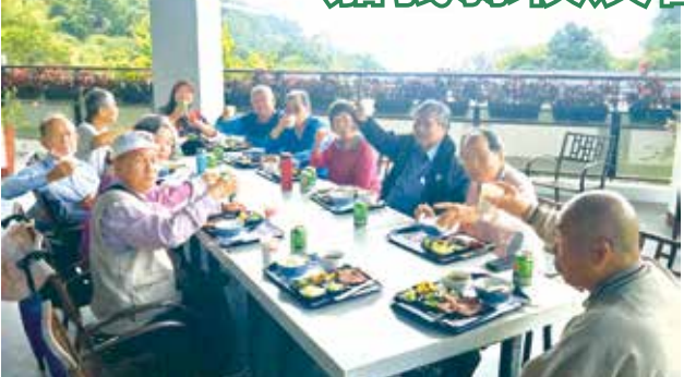
■嘉義縣校友會第13屆第3次理監事聯席會議