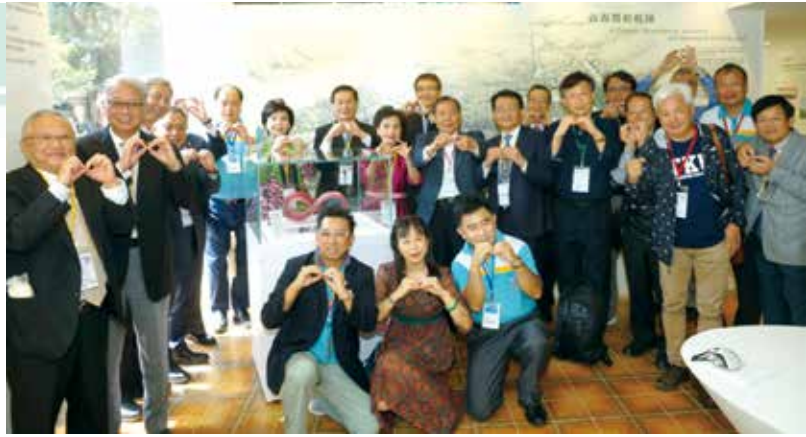
■2022春之饗宴∞玻璃藝術品揭幕合影

展「淡味創生知行學」，藉由校友企業的成就作為學生們的標竿學習目標，傳達本校永續不息「∞」的理念，包括農情食課知農惜農、淡北文化VR特展、青銀共習等。