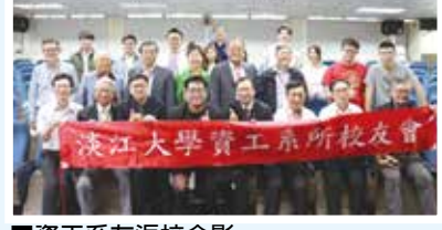
■資工系友返校合影