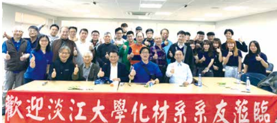
■化材系友會第8屆第2次系友大會合影

每年系友大會辦在春節後，系友可以在年後見面寒暄，促進系友聯誼，同時請在校系學會學生幹部協助活動報到，藉由主任系務報告、系學會會長做系學會工作報告，讓學長姐們更了解系上跟學弟妹活動的運作。會議中，系友交流活絡，歡笑聲此起彼落。當日適逢台北校園辦EMBA招生面試，葛煥昭校長會中蒞臨指導，與系友寒暄，系友大會在一片歡樂聲中順利結束，明年再會。