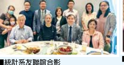
■統計系友聯誼合影