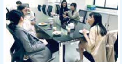
■歐洲所暨大陸所碩博士班餐會側拍