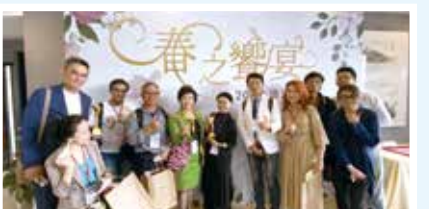
■大傳系主任、理事長與母校董事長及傑出系友合照