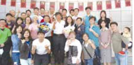
■數學系教師榮退餐會暨系友盃球賽合影