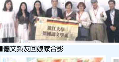
■德文系友回娘家合影