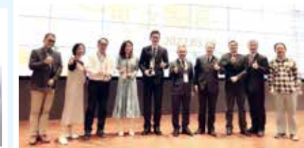
■戰略所友與傑出校友頒獎合影