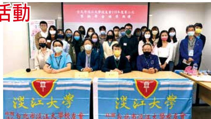
■台北市校友會4/17同心獎學金頒獎合影。

4/17(日)下午之「110學年度第二學期同心頒獎典禮暨學習心得報告」活動，獲獎同學共29位，按照同心獎學金獲獎要求，同學需於第二學期及學長姐及贊助人進行這一年來的學習心得報告。每位同學都卯足全力上台說明這一年來所見所學，而與會學長姐也用心的給予建議和指導。畢業學長姐們都肯定學弟妹這次上台報告比去年時台風更穩健、內容更豐富，也期勉同學每一年可以愈來愈進步。