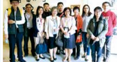
■教育、資圖系友回娘家合影