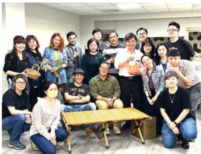
■大傳系友會TGIF露營炸雞趣合影