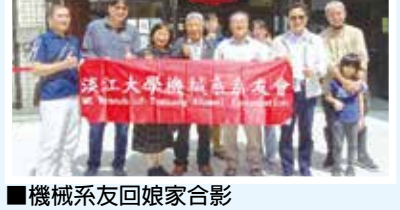
■機械系友回娘家合影