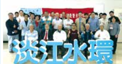
■水環系友會系友回娘家茶敘團體照