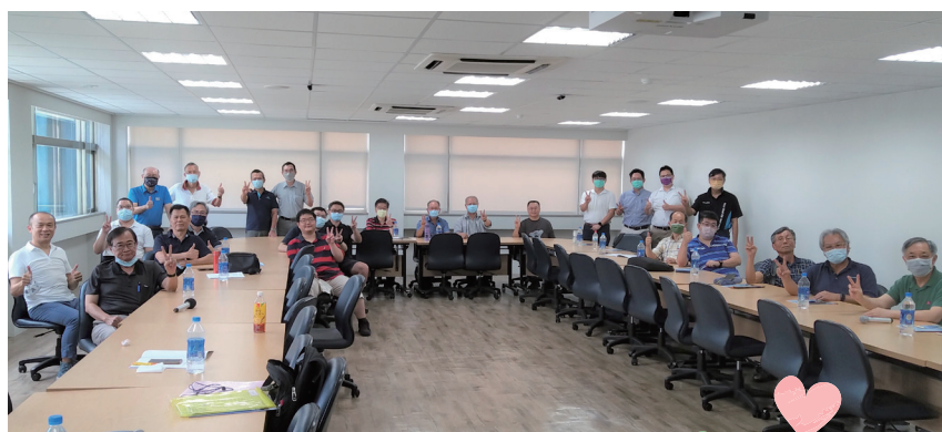
電機系友會第2屆第1次會員大會合影