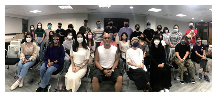
大傳系友會8月活動聯誼合影