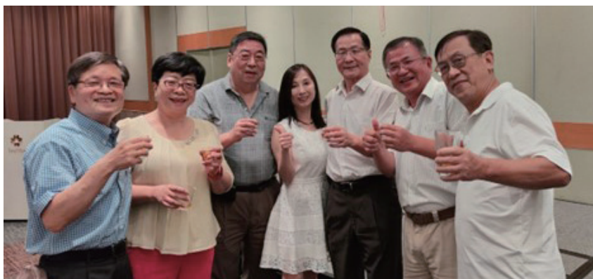
資工系友會與母校葛煥昭校長(右3)合影

舉還有校友會淡江人資訊協進會的會務報告加上理監事會議，最後邀請系上資訊週比賽優勝學生代表做專題報告。晚間6點開始進行聯合晚宴，晚宴中賓主盡歡好不熱鬧，也非常感謝這次大力贊助的學長們，讓所有的活動流程都能夠圓滿完成，再次感謝各級單位與學長姊的支持與協助。👍