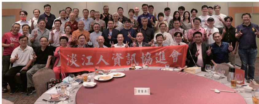
淡江人資訊協進會暨資工系友會聯合會議合影

許校友在復興廣播電臺擔任天使DJ，主持「活出美好」節目，曾入圍廣播金鐘獎；亦在大愛網路電臺主持「聽見生命力」節目，透過廣播傳遞正能量。除擔任志工外，也協助身障團體辦理職業重建課程，並以生命教育講師身分至各級學校宣導，服務奉獻精神令人感佩。(摘自1147期淡江時報)👍