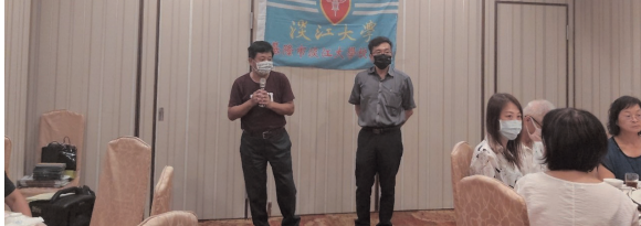
基隆市校友會第13屆第1次會員大會暨第1次理監事會議