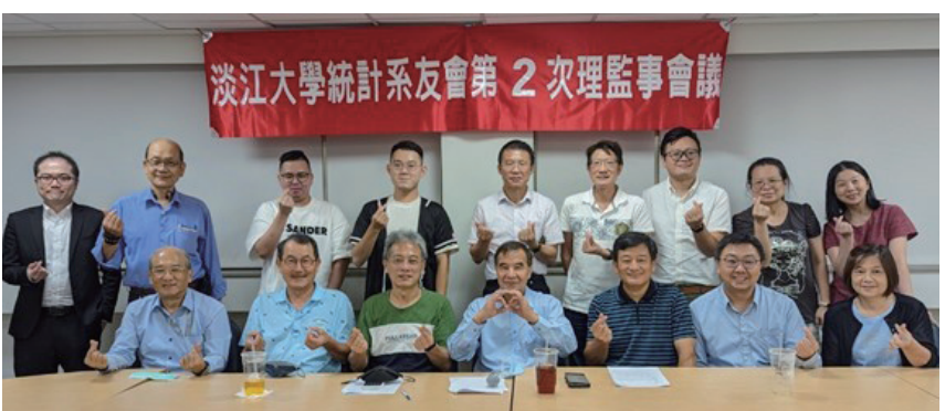
統計系友會第13屆第2次理監事會議合影

告、財務報告、系友動態分享，讓理監事們更了解系友會的活動及運作近況，會中也針對各項提案進行討論，持續配合系上辦理企業導師活動、參與學校校慶活動、支持母校活動，並且聯繫系友間感情，積極與系上合作辦理各項有助系上學生的相關活動。👍