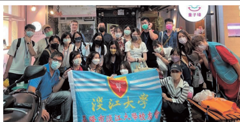
本校國際交換學生參訪基隆 基隆校友會展現在地人熱情