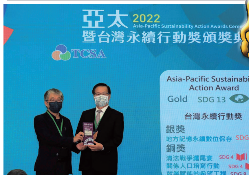
本校推動永續再受肯定 獲2022亞太永續行動金獎