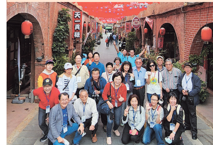
校友們與美麗街道合影