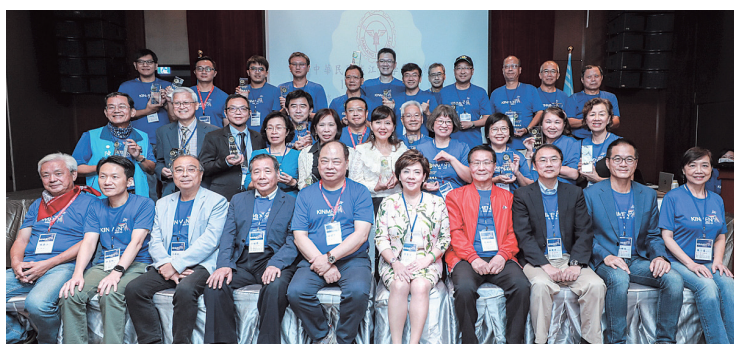
第10屆卓越校友獎26位校友大合照