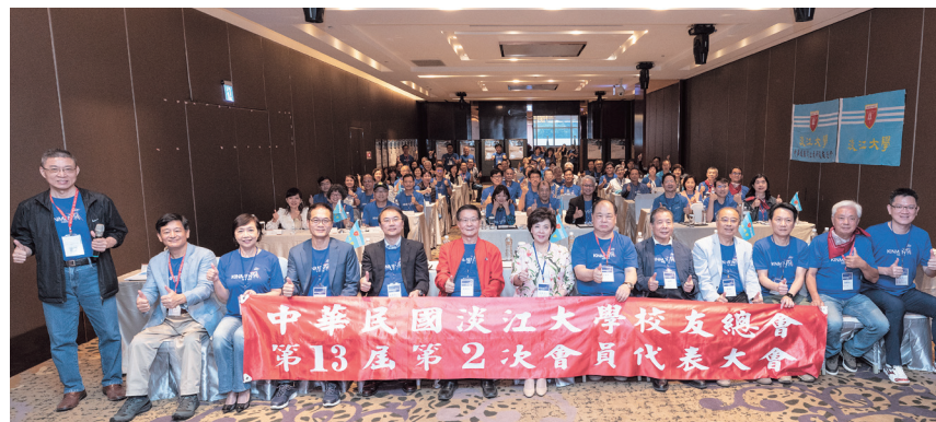
中華民國校友總會第13屆第2次會員代表大會會後合影