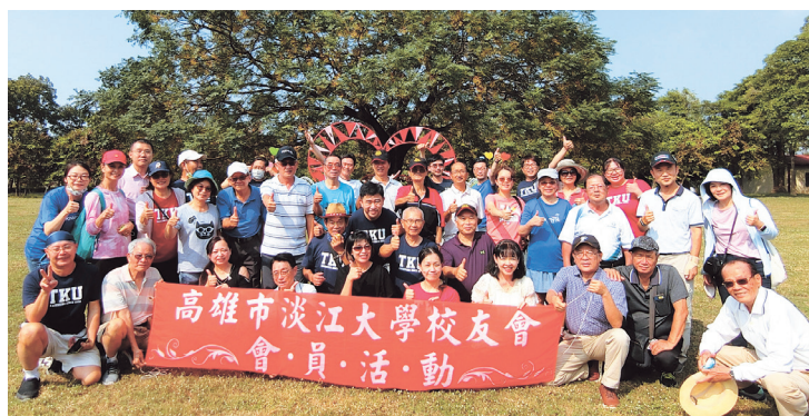
高雄市校友會秋季會員活動大合照

華中校友會2022年中秋團聚交流會，於9月3日(六)下午6時在老武漢傳統飯店舉行，校友偕同家人共進晚餐，相互交流聯誼，舒懷暢飲。雖與會人數不多，但大家都盡情歡樂，喝飲料品佳話諸家常，在疫情趨緩之際，難得的一次聚會。直到晚上8時，大家在互道珍重健康平安聲中結束難得的疫情後歡聚。