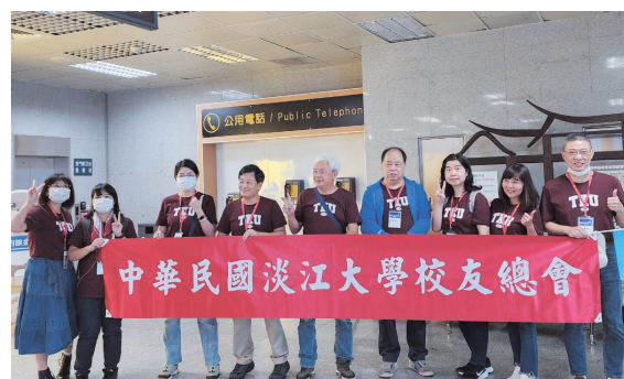
中華民國校友總會與校友處工作人員於機場接機