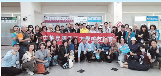
校友們搭船前合影