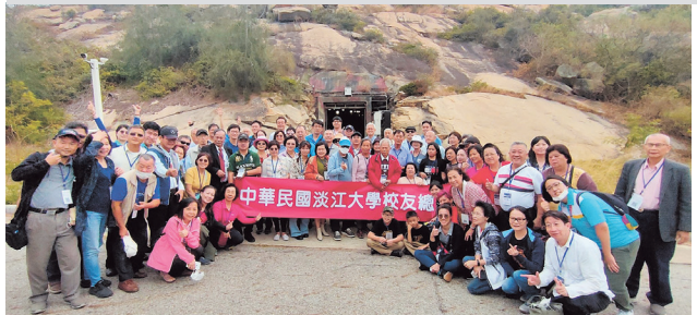
校友們坑道前合影留念