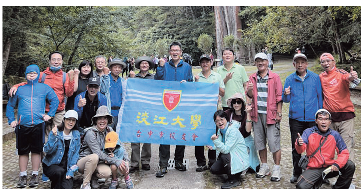
台中市校友會大雪山森林遊樂區避暑健走一日遊大合照

本日輕鬆走超過一萬步，而下山後還到東勢果菜市場採買當令蔬果，可說是滿載而歸！一早快樂出行、傍晚平安回家。感謝學長姐的參與及支持，校友聯誼活動會繼續辦的越來越好！一起來玩遍台灣、玩遍海內外！