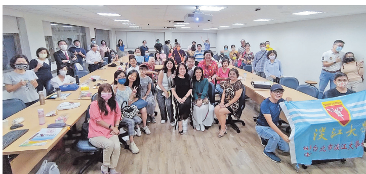
台北市校友會與9月演講者合影(台北市校友會提供)

經驗和實務的體驗，從元宇宙進行式、融入跨界思維、朝向永續趨勢，配合精彩的圖片說明，在短短不到二小時的時間內，毫不藏私傾囊相授。在場所有的學長姐都受益良多！