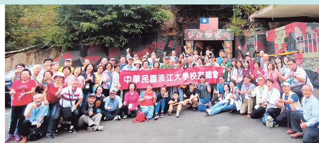
校友們擎天廳坑口合影