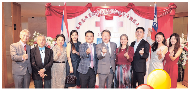
泰國校友會歡慶中華民國111年雙十國慶晚會大合照