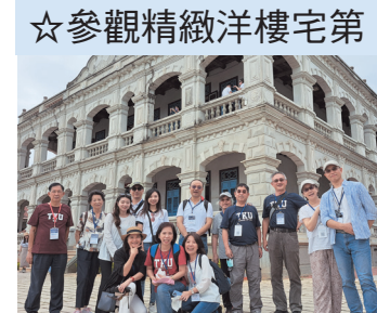
校友們與美麗建築合影留念