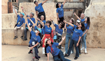
大家一起比出最美麗的POSE!