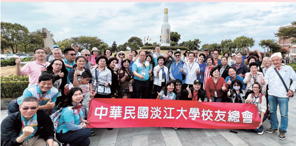
與金門地標金門高粱合影留念