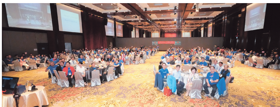
中華民國校友總會淡江之夜晚宴大合照