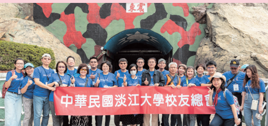
校友們坑道前合影留念