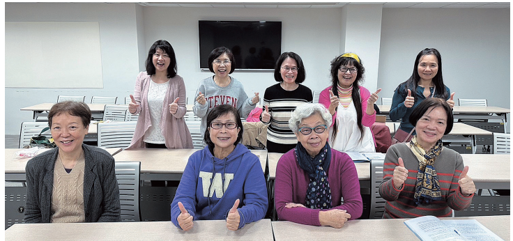
法文系友會讀書會合影

四晚上進行，目前閱讀的書是家喻戶曉的《可可·香奈兒傳記》。這位改變現代女人穿著、成為當時女性主義啟蒙的重要人物，她的一生太傳奇，充滿神秘色彩，有著說不完的故事，使得系友們莫不期待每週四的來臨！