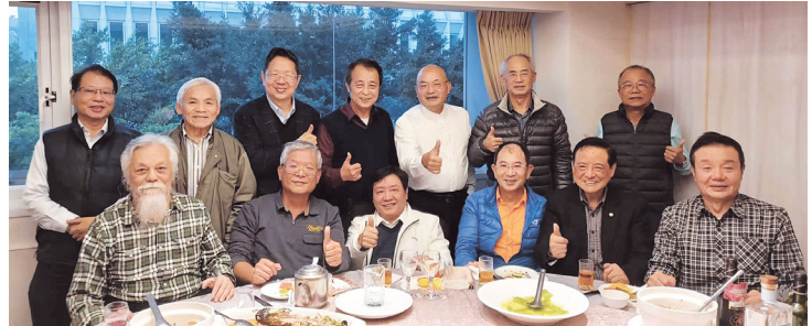
華中校友會春節聚餐合照

在董會長介紹後，大家相互拜年，舉杯互祝免年吉祥，在豐盛的酒席中一片歡欣喜樂，全體合照留影後，結束快樂免年新春團聚。