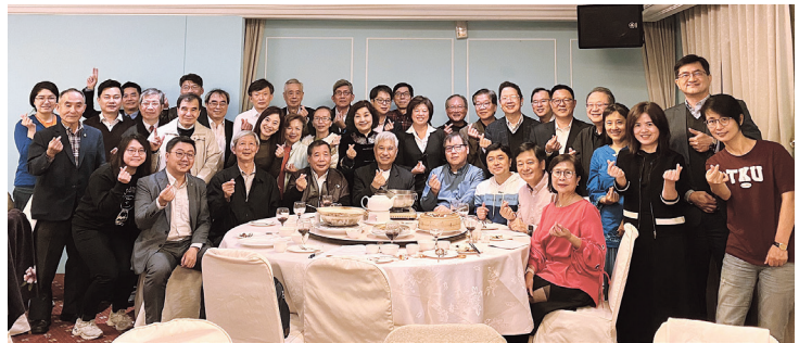
系所友會聯合總會春酒合影

因疫情影響，系所總會監事近2年沒有聚會，藉這次春酒活動，各系所友會分享近況，聊得開懷熱鬧盡興。大夥已開始期待今年一連串活動，包含3月春之饗宴、9月系盃高爾夫球賽及12月暫定以露營為主題的會員大會。