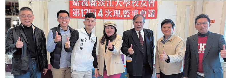
嘉義縣校友會第13屆第3次理監事會議

新竹市校友會人才濟濟，會中通過提名服務於台積電和工研院2位優秀校友參加「卓越校友」選拔，藍理事長表示歡迎校友們加入新竹市校友會大家庭。(全文請詳電子報)