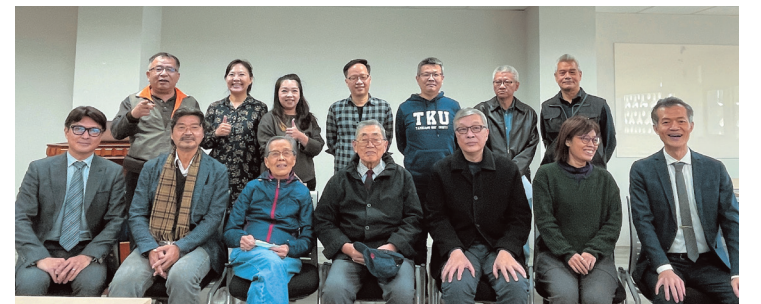
建築系同學會理監事會與傑出系友合照

會同學向各位系友報告今年系展的規劃以及系友返校的活動安排，這也是本次會議的一大亮點，整個會議氣氛熱烈、積極向上。相信這樣的交流活動可以加強同學們之間的聯繫，為母系的未來發展助力。