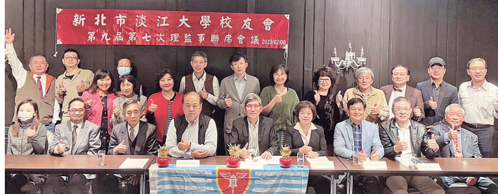
新北市校友會理監事會議氣氛熱絡

席。會中預告中華民國校友總會將於10月14-15日在台中舉辦會員大會，以及母校將於3月18日(六)舉辦春之饗宴活動歡迎大家預留時間；另提案討論本會4月23-24日花蓮2日遊活動。會後餐會聯誼暨春酒，期許今年會務順利昌盛。