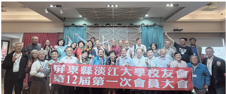
屏東校友會會員大會合影

主持，會中通過111年決算及112年預算、章程修訂、3至4月的活動規劃。且同時進行理監事改選，依會員投票推選出