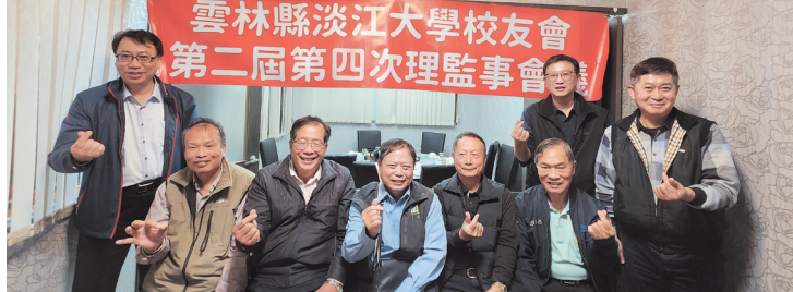
雲林縣校友會第2屆第4次理監事會議合影