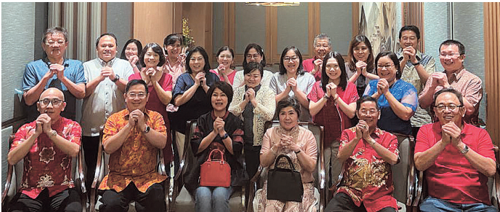
印尼校友會新春聚餐合影