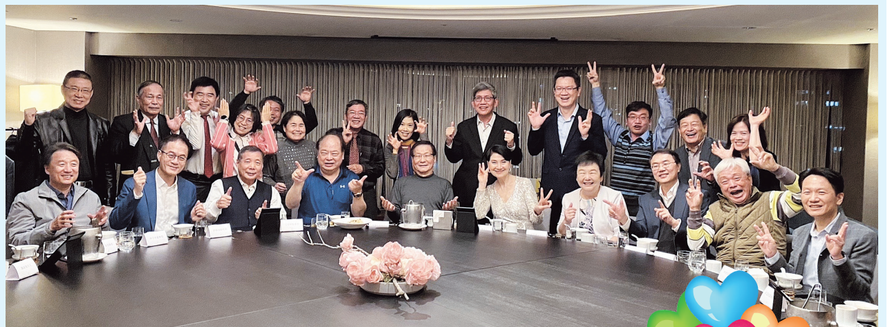
葛煥昭校長（前排左5）邀請縣市校友會會長進行歲末餐敘