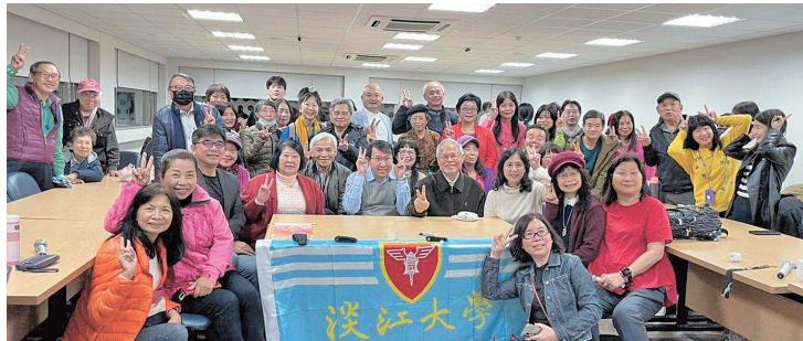
台北市校友會2月份主題演講及慶生會活動合影

民歌，大家沉醉在甜美的回憶裡！台北市校友會另於1月10日(二)晚上7時，在校友聯誼會館D508召開第12屆第3次理監事聯席會，會中討論112年度相關活動規劃；另於2月11日(六)，舉辦漫遊坪頂古圳和平菁街櫻花巷賞櫻半日遊活動，大夥漫步於美好的春光下，享受歡快的一天。(全文請詳電子報)