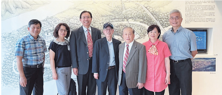
旅美校友一行參觀校史館合影留念

與的校友會活動。此外，陳理事長和段榮譽總會長分別是第10屆和第12屆金鷹校友，他們也在介紹資料前拍照留念。隨後，他們參觀位於2樓的張建邦創辦人紀念館，除了對創辦人於本校和國家社會的貢獻感到敬佩外，段榮譽總會長分享了創辦人曾以校園建築和周遭景觀為例，鼓勵學生保持登高望遠、胸懷天下的廣大胸襟。校友們此行共同追憶母校的過去，並展望充滿希望的未來。