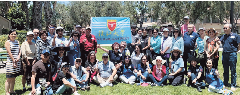
南加州校友會爾灣小聚合影

Trailwood Park小聚，迎來了46位聊有說有笑，在風光明媚的爾灣淡江人及其眷屬參加。校友們各度過淡江人的美好時光。自帶拿手好菜分享，大家吃吃聊