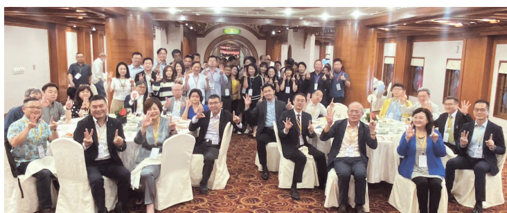
大陸所友會30+1週年慶大合照

校友參與，與會者計有80位。連理事長感謝師長們與所友們的蒞臨、在疫情期間籌劃30週年所友會慶生的工作團隊，同時勉勵學弟妹致力於學業的學習及各種生活體驗。在專業那卡西營造的歡樂氣氛與依依不捨中，所友們相約明年30+2週年所友會慶生會再相見。