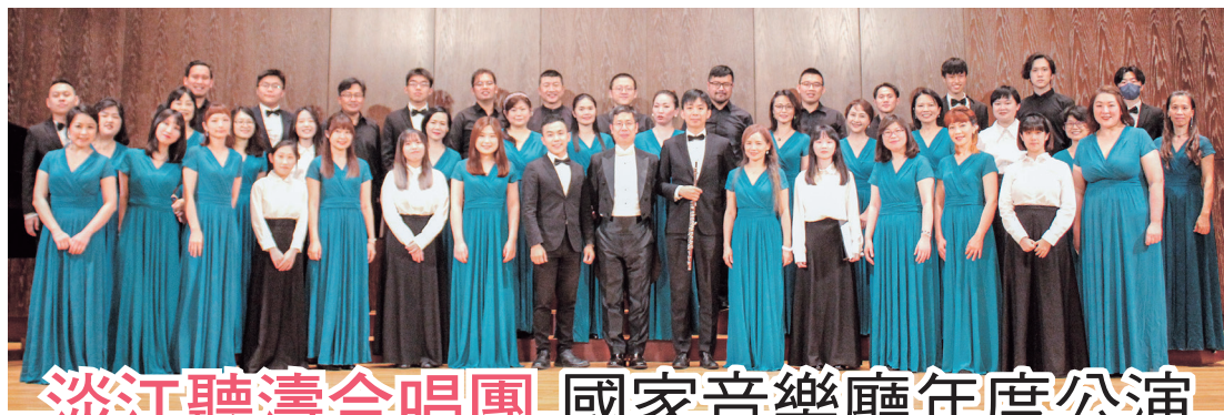
(上圖)淡江聽濤合唱團於國家音樂廳年度公演合影

前母校的前瞻性校務發展。相聚是為了再次的相聚，即使年歲增長，期許這群好朋友能持續參與支持同學會和母校，凝聚因淡江大學輪機系而連結的緣分。