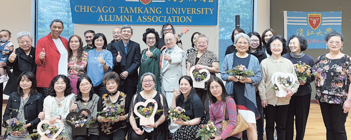
芝加哥校友會母親節手工藝感恩茶會大合照

慰問和捐款。僑教中心黃世聰副主任致詞讚揚校友會籌辦這次活動的文化多元性，除了插花中國結外，另有國劇、太極等精彩藝文表演並祝大家母親節快樂。(全文請詳電子報)