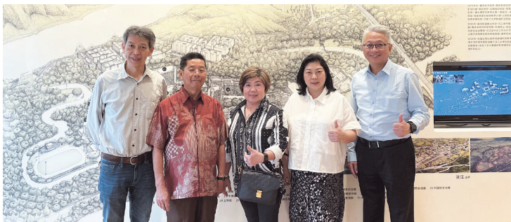
校友們於校史館合影留念

因疫情而延期舉辦的世界校友雙年會，即將由印尼校友會在雅加達主辦，學長們正在積極籌辦這一盛會，並熱切期待校友們的踴躍參與，相關資訊將在校友處的網站上公告，敬請期待。