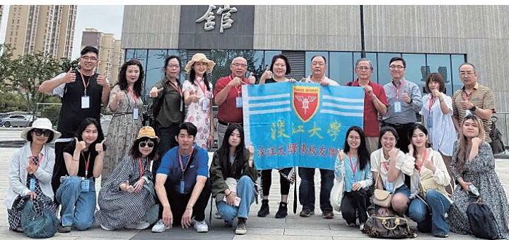
華東校友會於中國黃梅戲博物館前合影

在4天3夜的行程中，校友一行人參觀了黃梅戲博物館、聆聽黃梅戲知識講座、欣賞黃梅戲經典曲目、觀看黃梅戲教學、體驗黃梅戲表演，厚重的文化底蘊、嚴謹的教學體系、精湛的舞臺表演，讓大家獲益匪淺！透過初步認識，黃梅戲