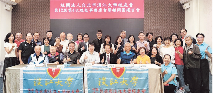
台北市校友會第12屆第4次理監事聯席會暨顧問團建言會大合照(台北市校友會提供)