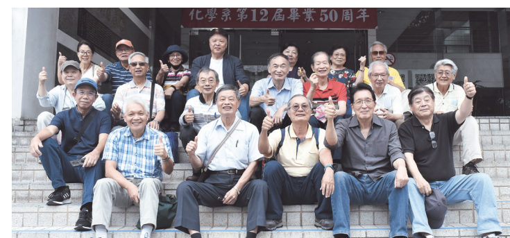
化學系第12屆50週年同學會合影

的回忆。影片結束後進行生活點滴與人生體驗分享，其中一位學長說他的分享很是符合約法三章的一不誇才，二不炫富，登時了解這是他們能夠維繫長久友誼的因素之一吧！