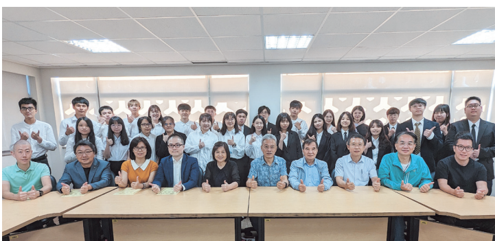
統計系企業導師活動成果發表會大合照

統計系友會另於5月10日(三)下午6時，於台北校園D508舉辦第13屆第4次理監事聯席會議。