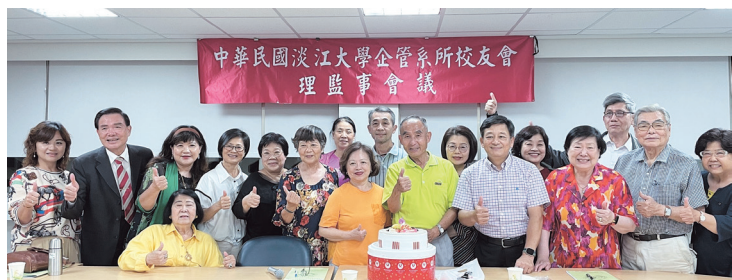
企管系所校友會第5屆第6次理監事會合照

雅加達召開世界校友雙年會。會中除向理監事報告今年舉辦參與的各項活動與財務現況以外，並有多項議案討論，同時舉辦第2季慶生會。