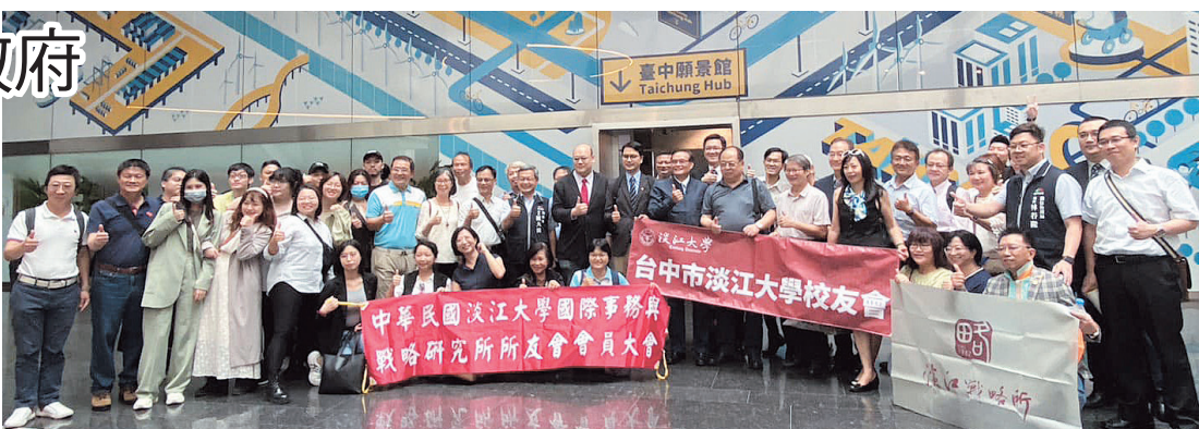
台中市校友會與戰略所友會訪台中市政府合影

很高興來拜訪盧市長，近年市府的成果有目共睹，學校與有榮焉，希望透過教學相長，讓淡江發展更完整。中華民國校友總會會員大會將於10月在台中市舉辦，盧市長也邀請各地的淡江人一起齊聚台中，見證台中發展新風貌。