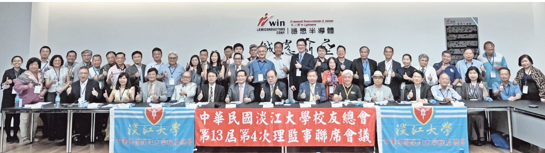
中華民國校友總會理監事會議合影

進行餐敘，享用QP咖啡餐點的同時大家熱烈交流，為此次理監事會議畫下完美的句點。下午所有理監事們一同出席總會讀書會「永續創新與社會責任」論壇，期待於今年10月14日(六)、15日(日)的第14屆第1次會員代表大會再相逢。